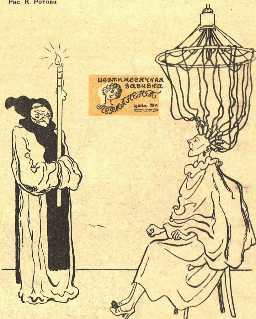
Рис. Н. Ротова

ВЕЛИКИЙ ИНКВИЗИТОР: - Эх! В мое время этому изобретению цены бы не было!