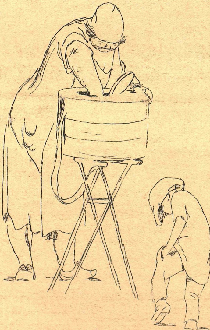
Рис. Л. Соифертиса