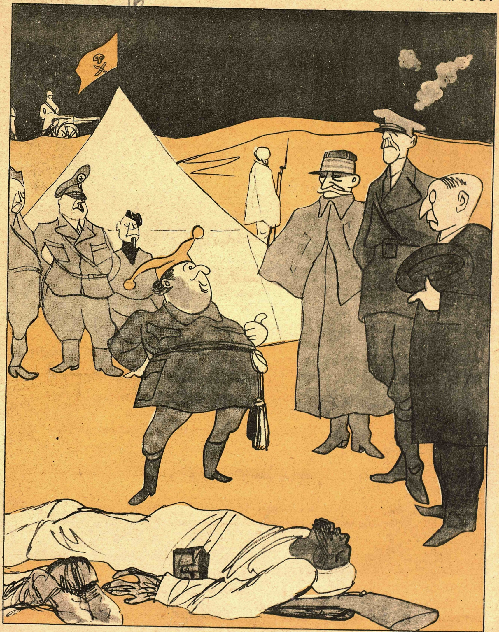
ФРАНКО:— Да если хотите знать, джентльмены, я дважды воюющая страна! Я на фронте воюю—раз и у себя в тылу воюю—два!..