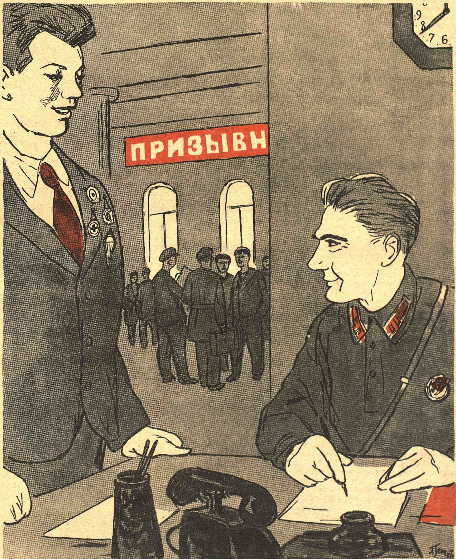
Рис. Л. Генча