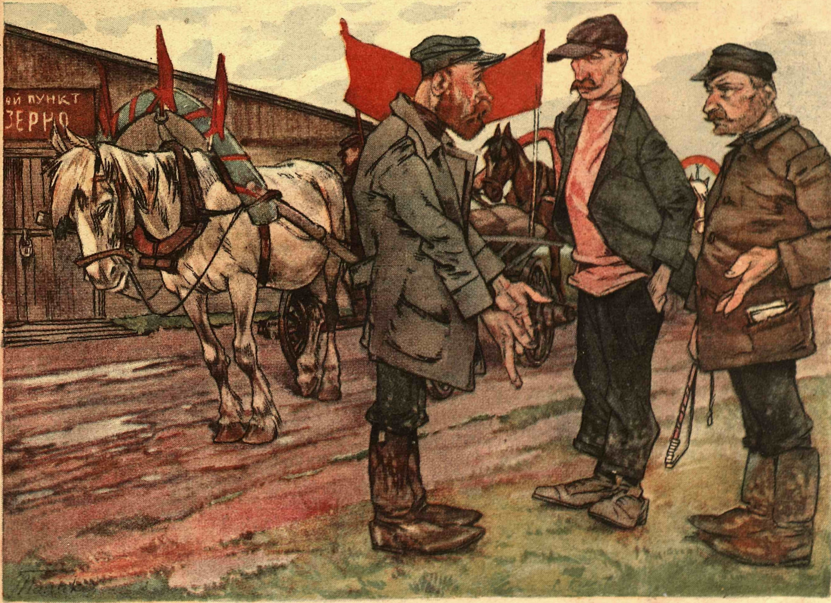
Рис. А. Толикова (тема М. Глушкова)

— Что же вы не встречаете обоз? — Встречные теперь воспрещены!