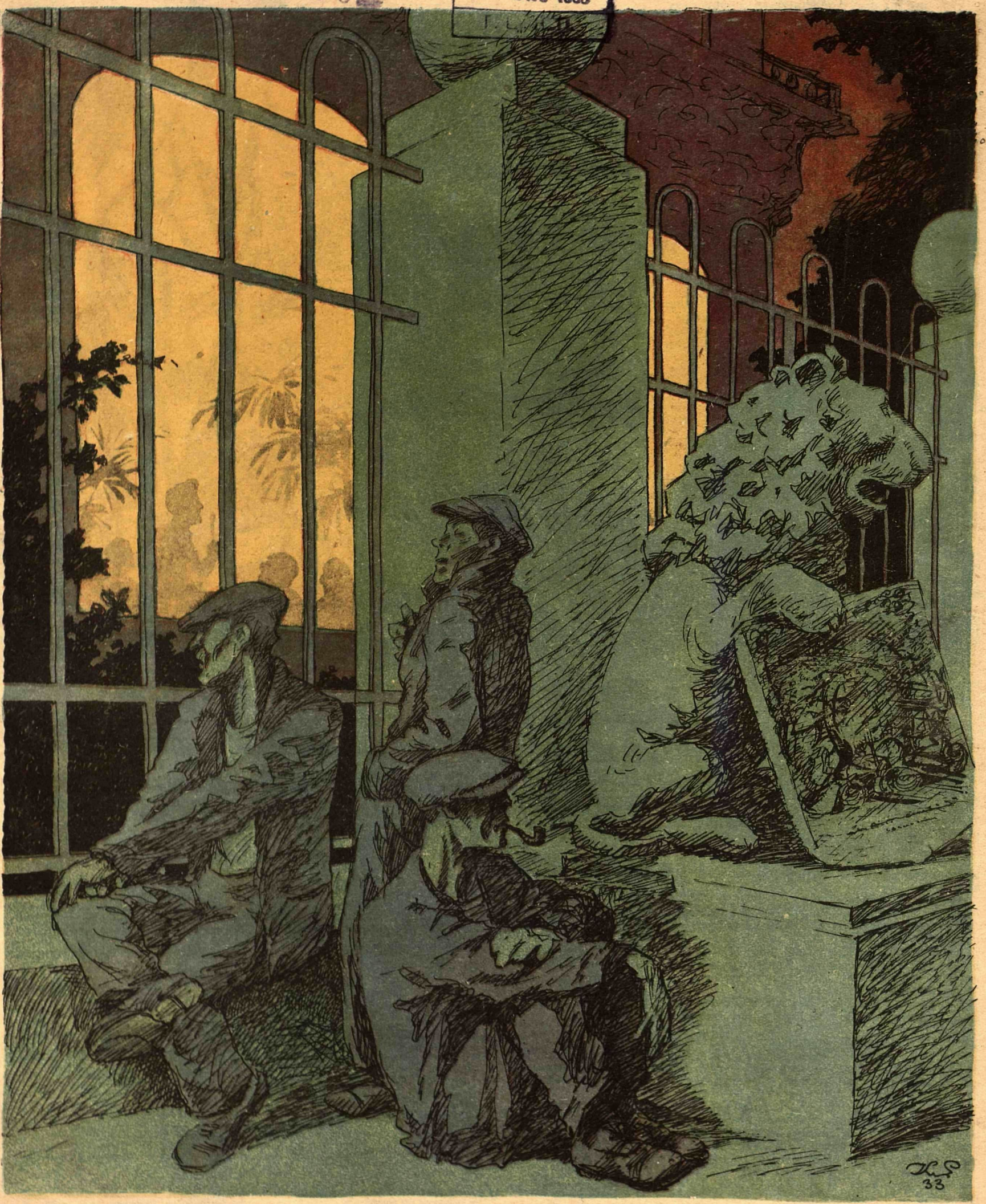
— Слышишь, они пьют за нас... — Они не только пьют, они за нас и едят.

будет на-днях тчк специальный выпуск тчк шестнадцать страниц тчк вилы шлем тчк