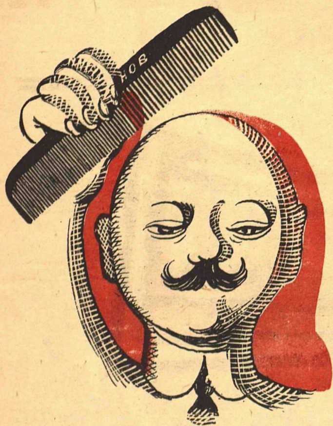
Рис. К. Ротова (тема М. Глушкова)