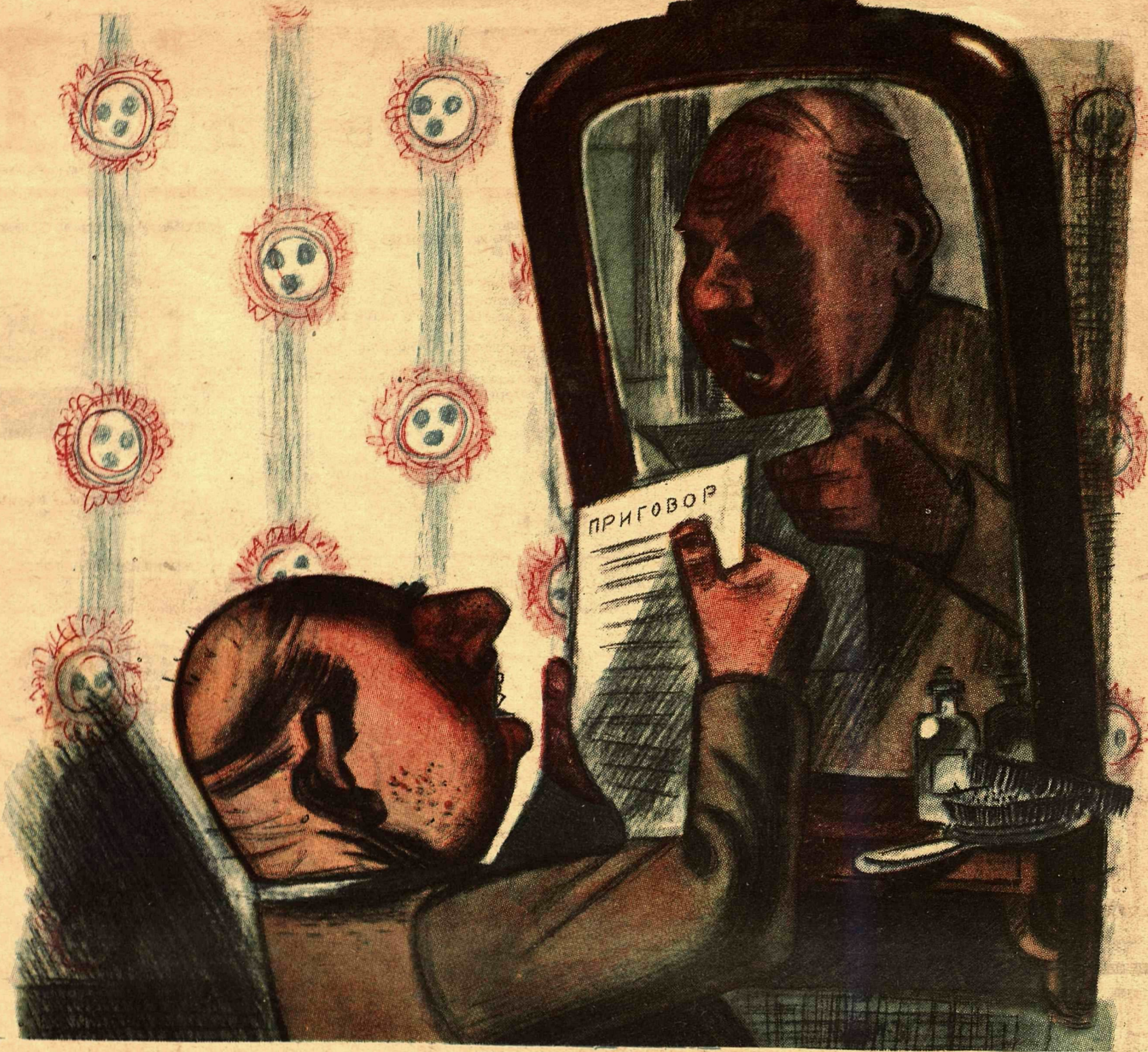
Рис. Ю. Гинфа (тема М. Глушкова)

Замечен «КРОКОДИЛ В ВОЗДУХЕ». Зылетел из редакции по направлению к типографии. Там задержался недолго На-днях появится в продаже. По секрету сообщаем: в выпуске 16 страниц, много рисунков и литературного материала, воздушный рожд крокодилцев и т. д. Примите меры!