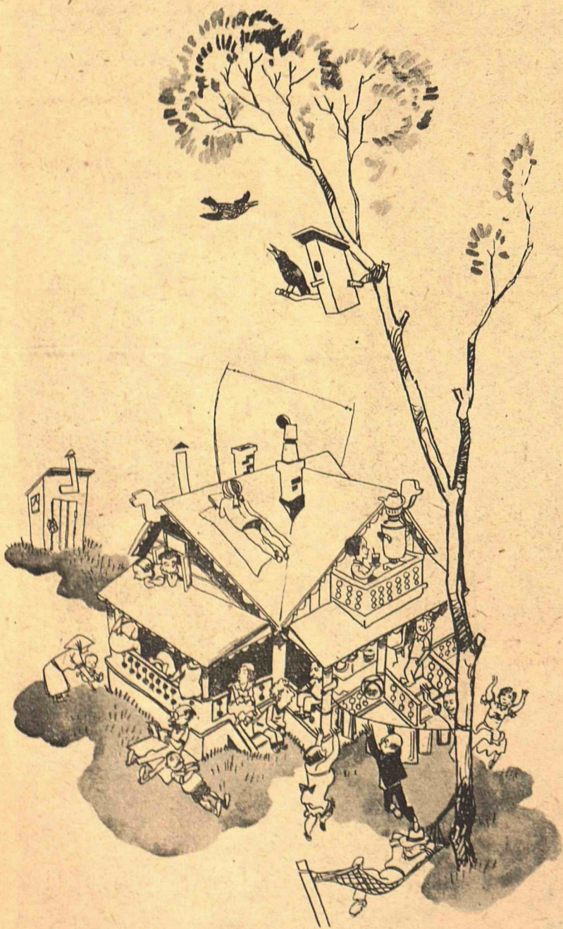
Рис. М. Храпковского (тема А. Бухова)