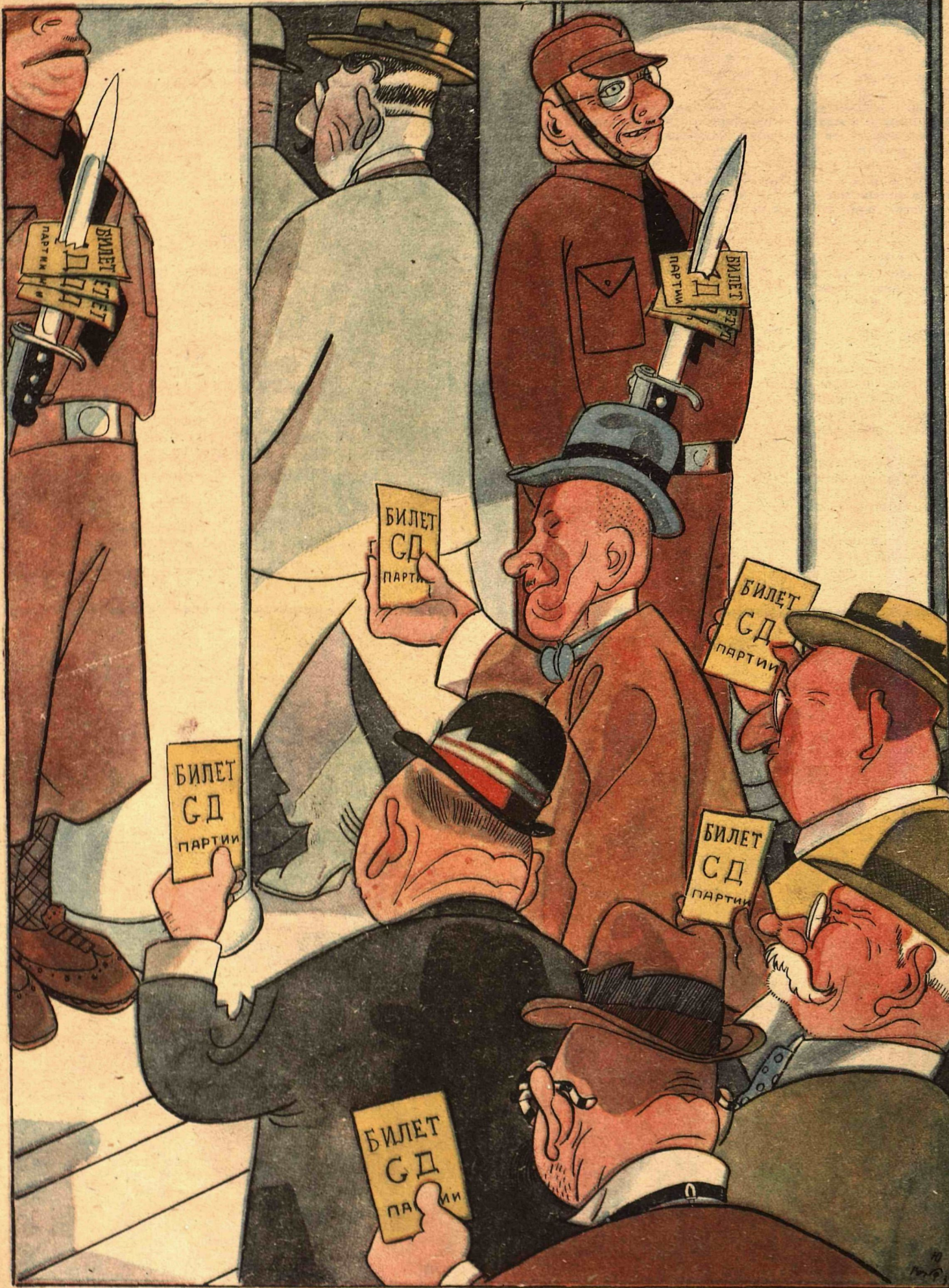
Рис. Ю. Ганфа (тема М. Глушкова)

Заседания германского рейхстага происходят в театре.