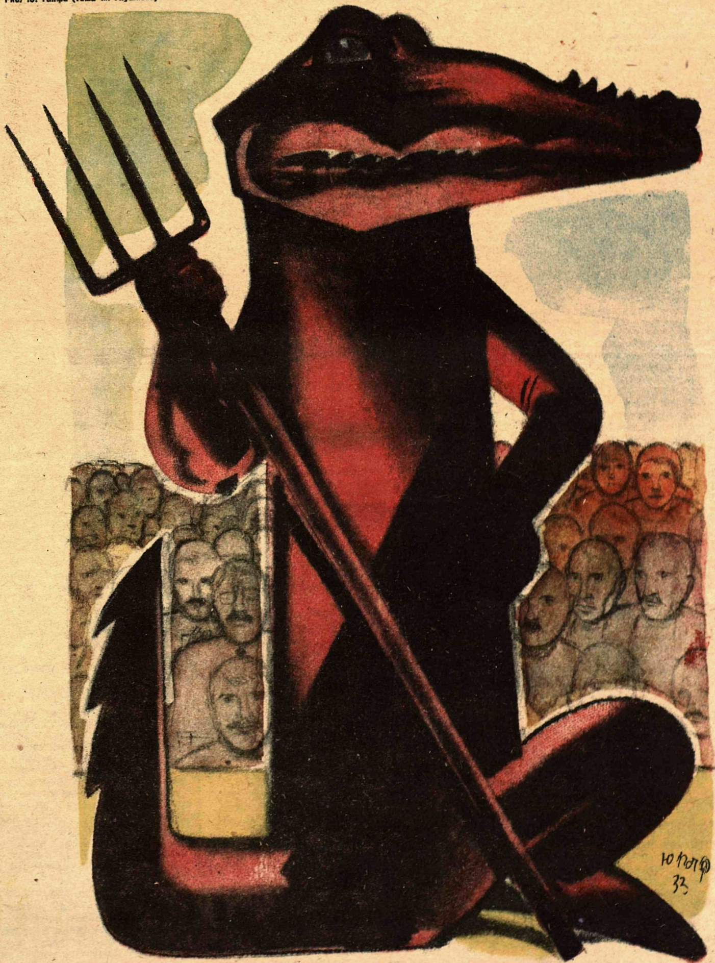
Рис. Ю. Ганфа (тема М. Глушкова)