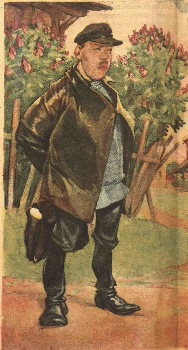
— Ведь каждый день с тобой встречаю тебя проглядел.

— А по-моему, парксизмом — ленинизмом пушай бес-партийные занятия... Наше дело — руководить, а не читать!