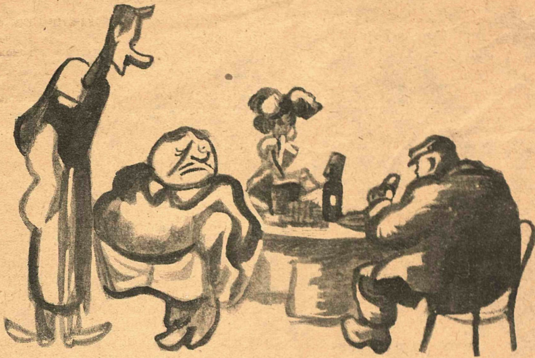
— Как бы из-за этих битков драться не начал? — Ничего. Тошнить его начнет в Орле, а жаловаться он сможет только в Курске.

Читатель остается в тяжелом недоумении: то ли настольному календарю место под столом, то ли у отрывного календаря надо сразу оторвать все листочки и выбросить?!