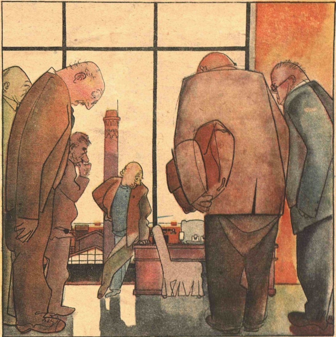
— Сказали, что грош мне цена как партийцу.. Интересно б, однако ж, выяснить: повышено это цен или снижено?..

Иногда не дописав письма, зоотехник прятал его под замок в чемодан, быстро, но густо ужинал и бежал на маяк. Он часами высиживал в мазанке маячника, глядел на его толстобедрую жену, жадно облизывал тонкие лиловые губы и все выжидал того