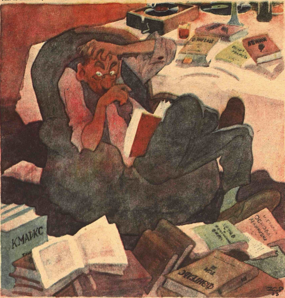
— Ну, разве можно все это за одну ночь прочитать!