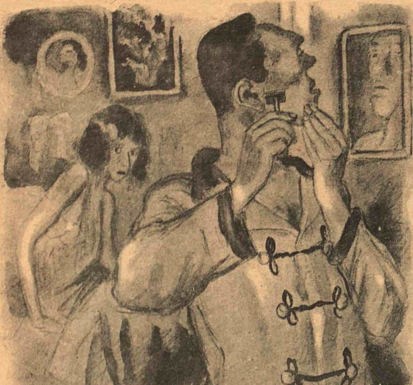
Рис. Л. Генча (тема Я. Бельского)

— В прошлую чистку у тебя пять лет стажа срезали. А что если опять? — Ну, что ж, буду должен партии три года. Разве нельзя?