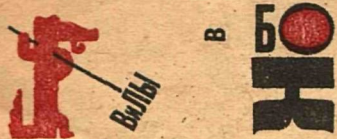
рис. Л. Бродаты (тема М. Глушкова)

Обеды в буфетах Курской дороги изготовляются из недоброкачественных продуктов.