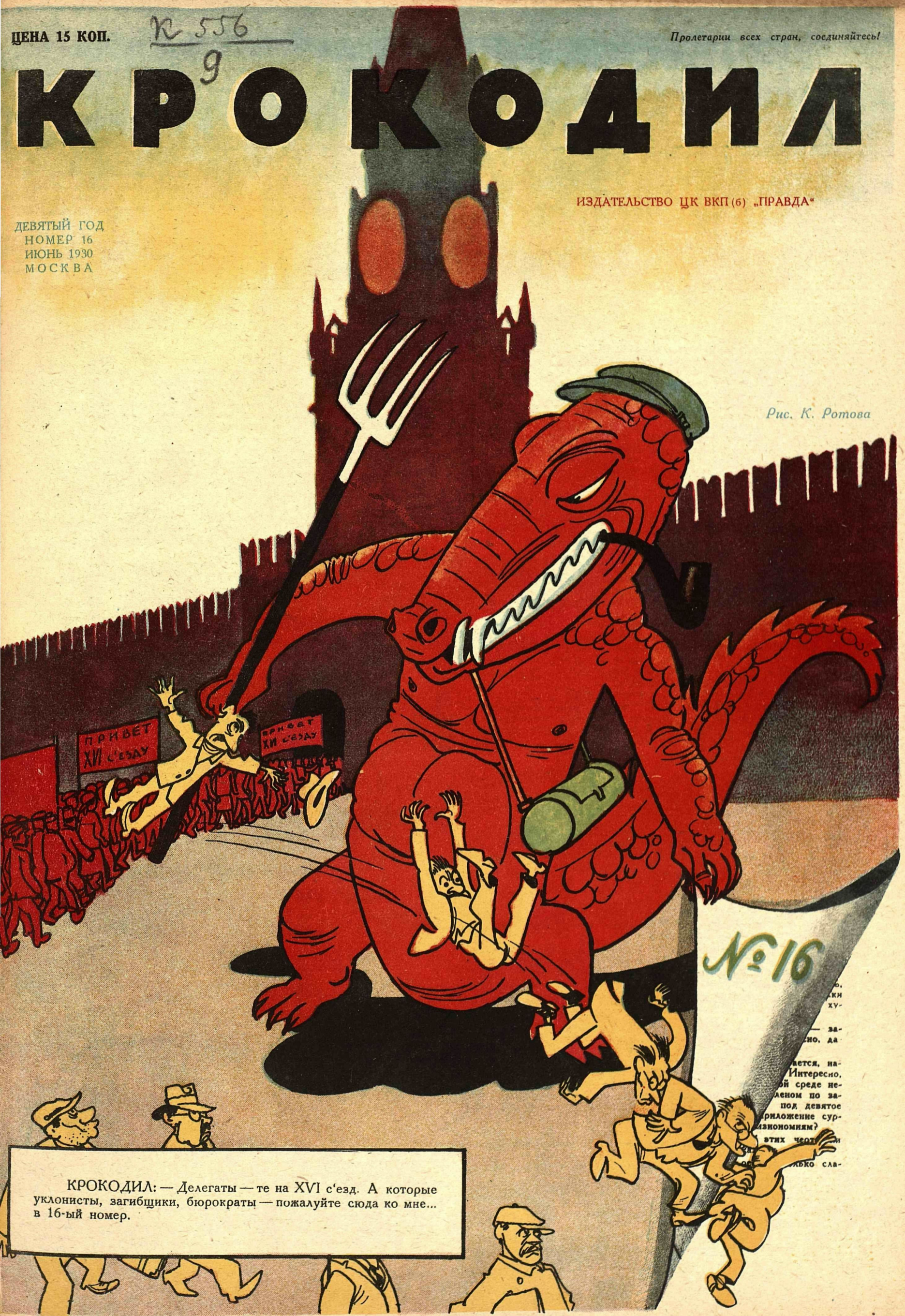
Рис. К. Ротова

КРОКОДИЛ: — Делегаты — те на XVI с'езд. А которые уклони́сты, заги́бши́ки, бюрокра́ты — пожа́луйте сюда́ ко мне... в 16-ый номер.