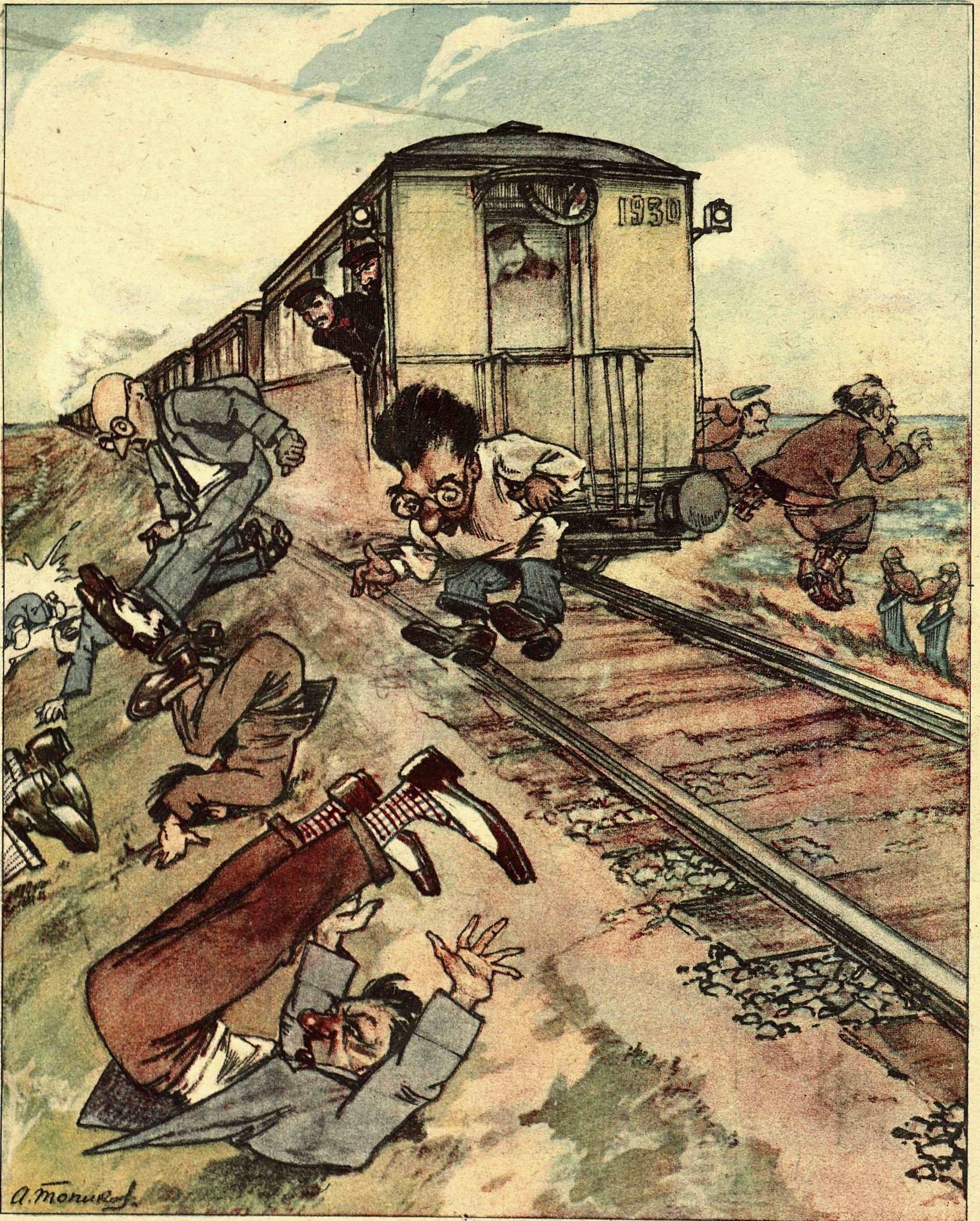
Рис. А. Топикова