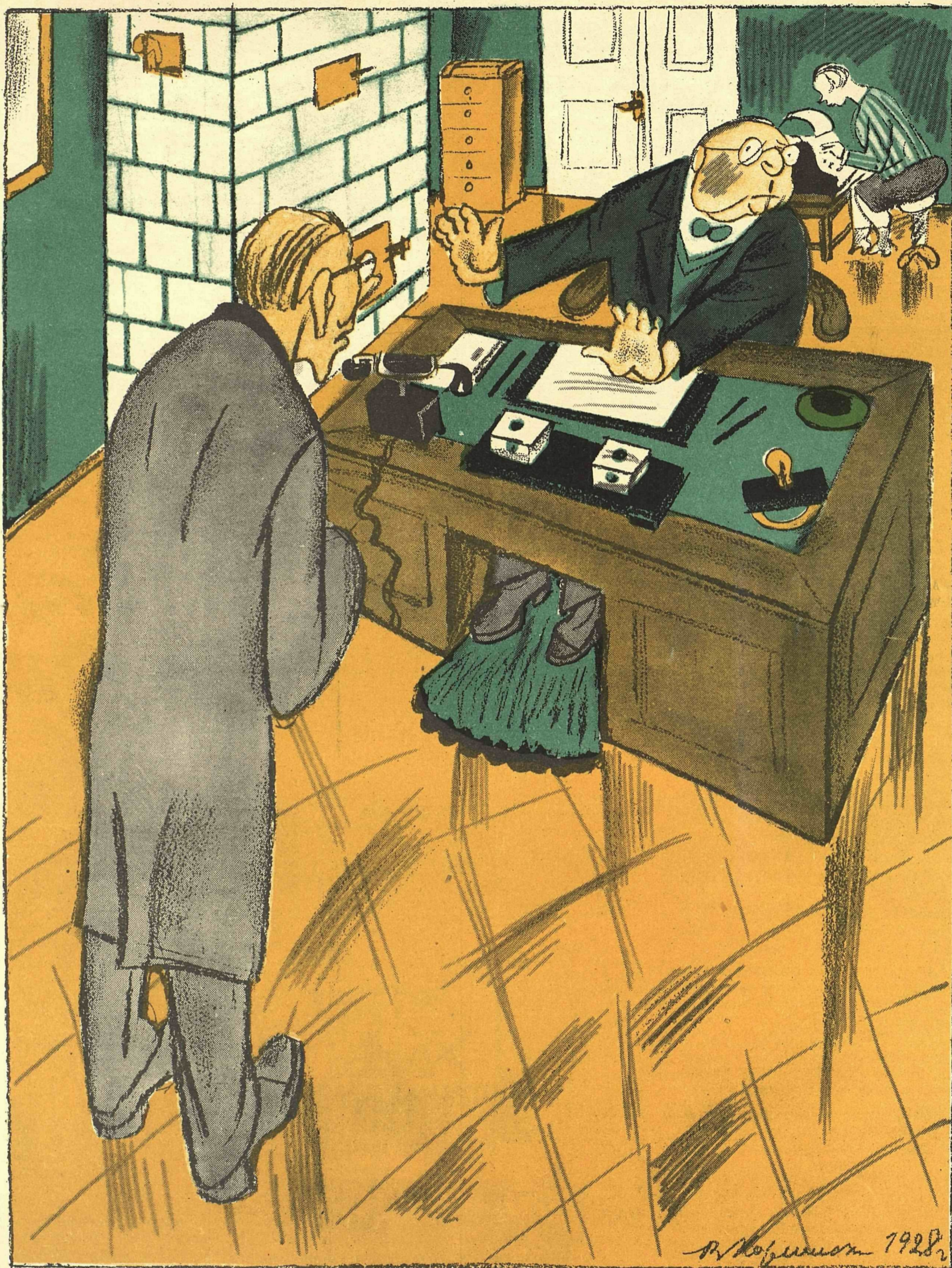
Рис. В. Козлинского