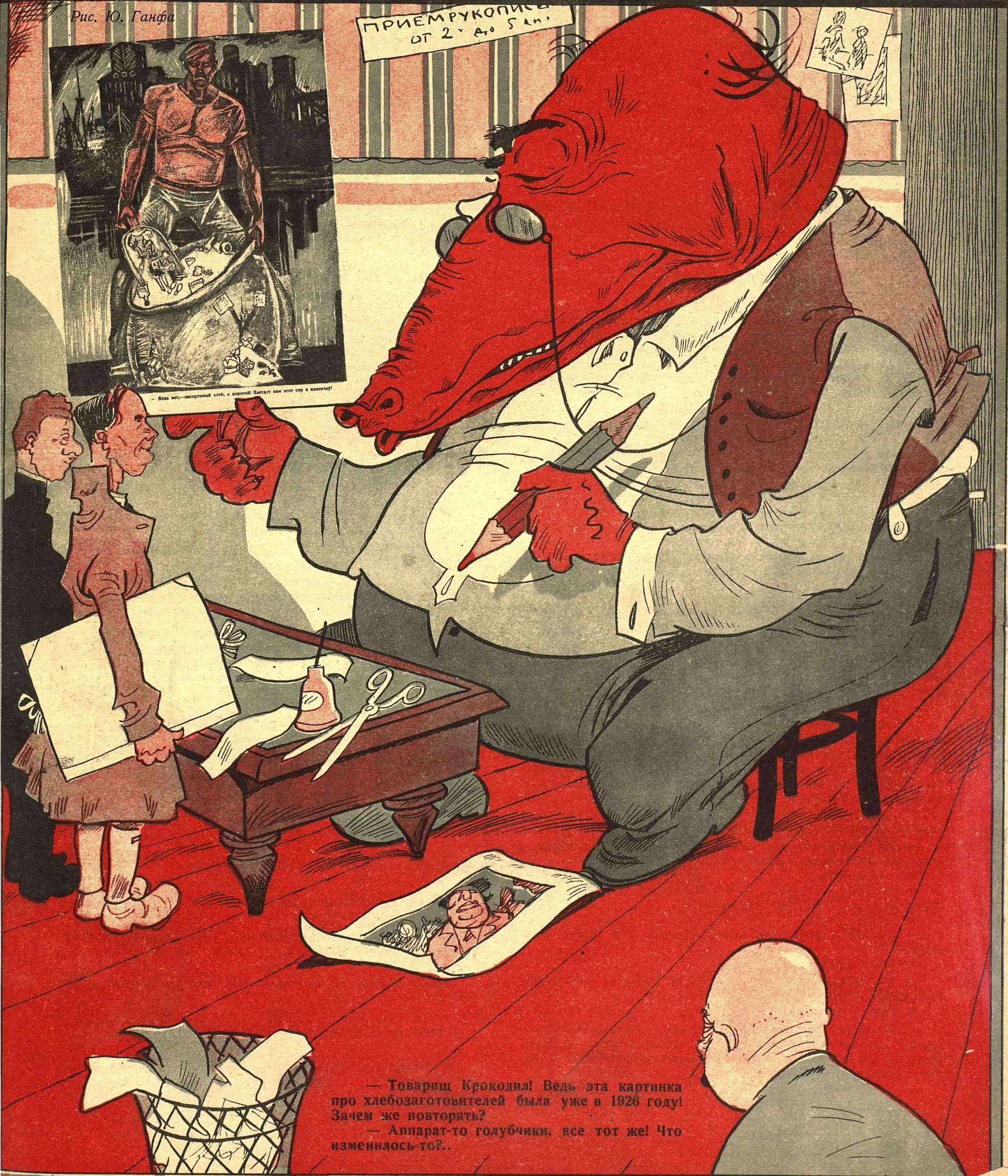
— Вась вот, — засорявший хлеб, а дорогой! Выбавь нам этот сор в колеску!

— Товарищ Крокодил! Ведь эта картинка про хлебоготовителей была уже в 1926 году! Зачем же повторять? — Аппарат-то голубчики, все тот же! Что изменилось-то?..