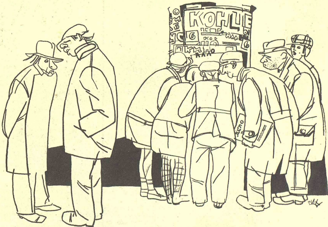
Рис. В. Гин