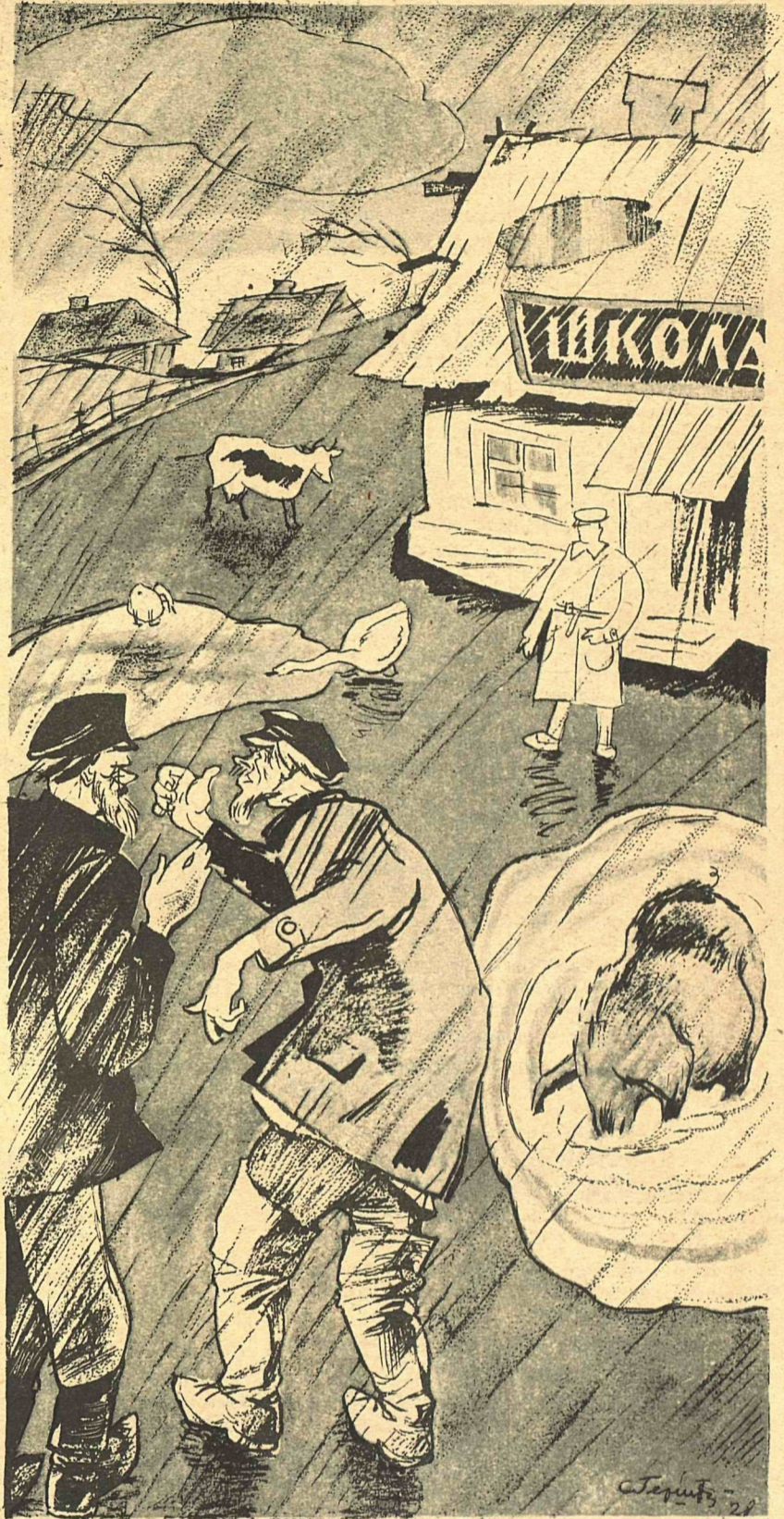
Рис. С. Герштейна