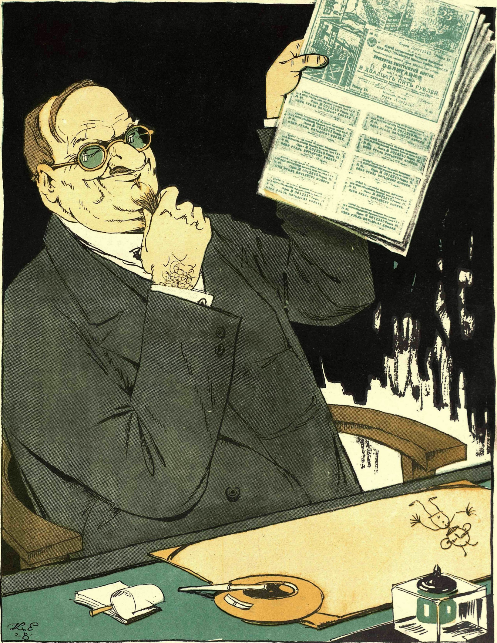
Рис. К. Елисеева