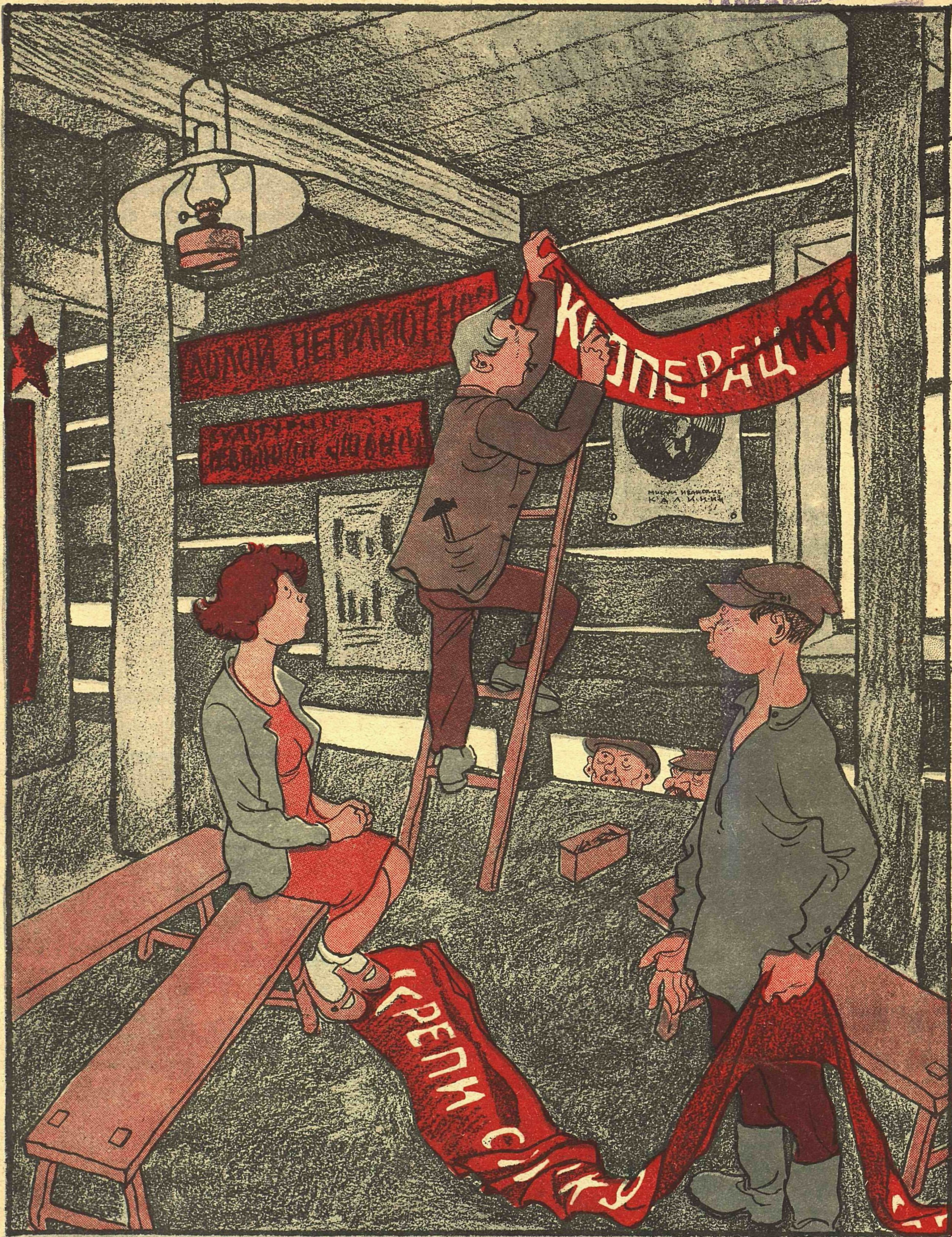
Рис. К. Ротова

— Неужели к Октябрьской годовщине уже украшаетесь? — Нет, щели старыми лозунгами затыкаем, — дует очень, будь оно проклято!