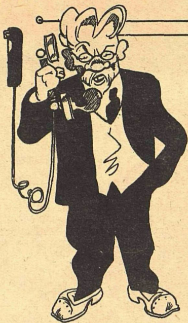
Рис. К. Ротова

Тов. КАЛИНИН.—Хлебозаготовки?! Алло! Хлебозаготовки!!! МРАЧНЫЙ ГОЛОС:—Аппарат испорчен, не работает!