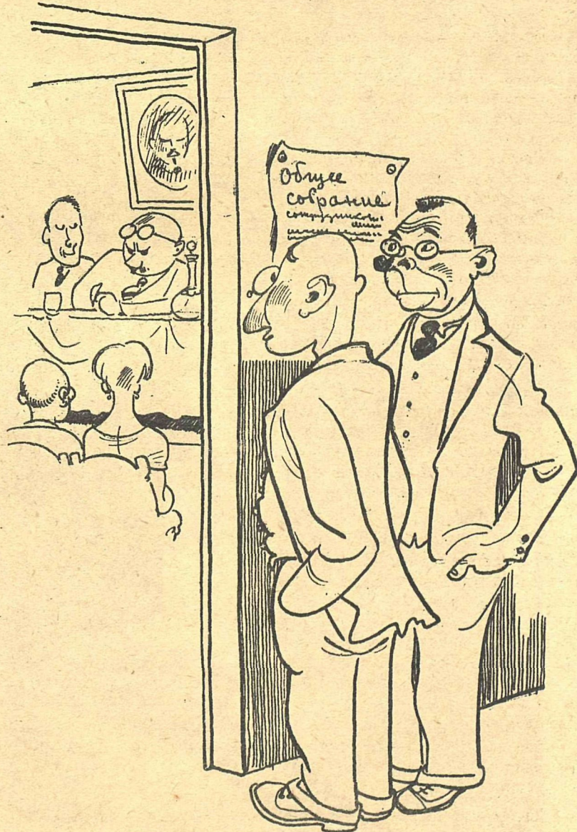
Рис. К. Ротова

— Не боится сам самокритики-то! — Чего бояться, — одни родственники пришли, не подведут!