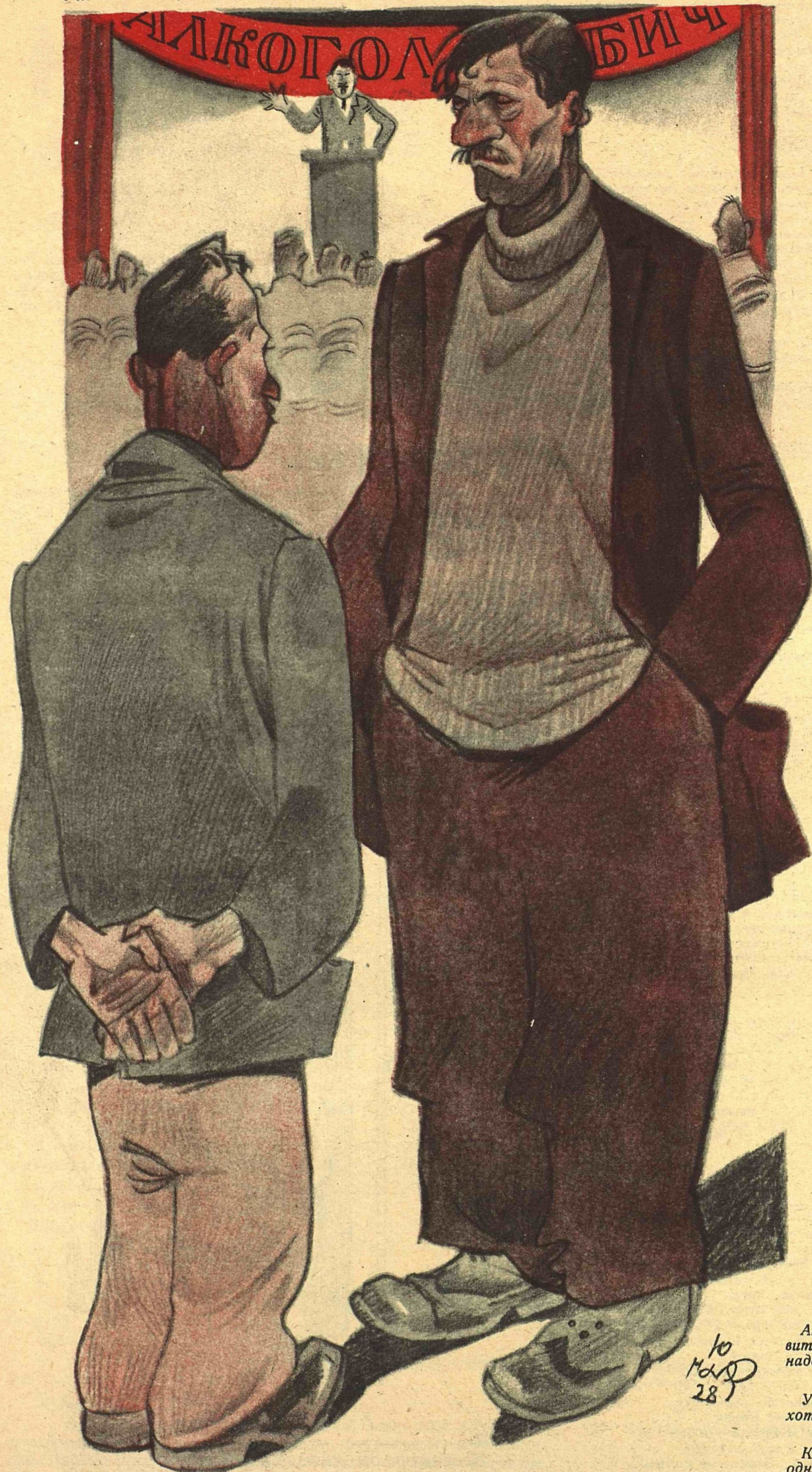
Рис. Ю. Ганфа