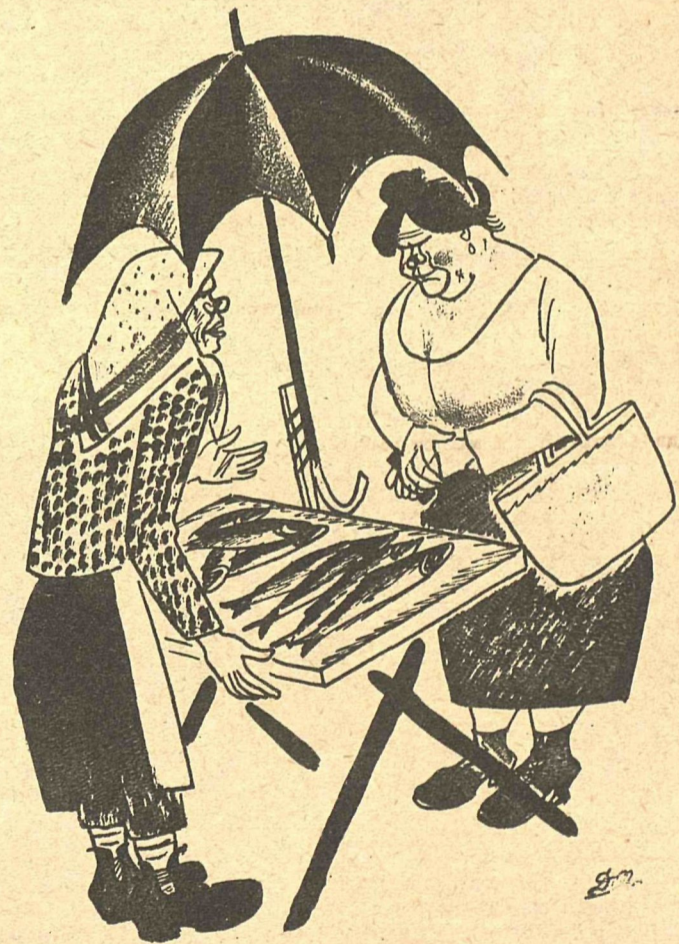
Рис. Д. Мельникова

— Рыбка-то тухловатая, — пойду лучше в кооперативе возьму.