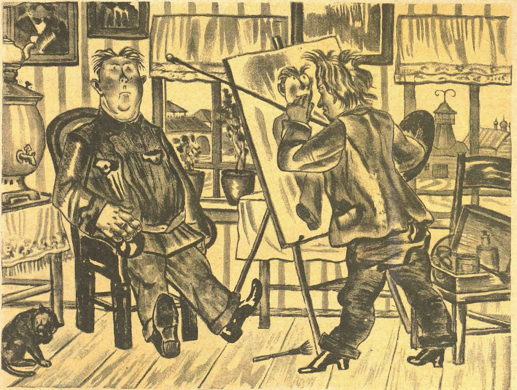
Рис. И. Каликина

Чистым искусством не будешь сыт, — Нужен и чай и сахар. В Москве хорошо, — там новый быт: Заказы, выставки, АХРР'ы. А к нам, в уездный наш городок, Из центра никто не ездит. Столичный художник вряд ли бы смог Выжить в нашем уезде. Верьте, у нас получить заказ — Как выиграть двести тысяч. За десять лет пришлось лишь раз Паршивый бюстишко высечь. Взял завкоопом один натюр-морт — В лавке прибил для рекламы