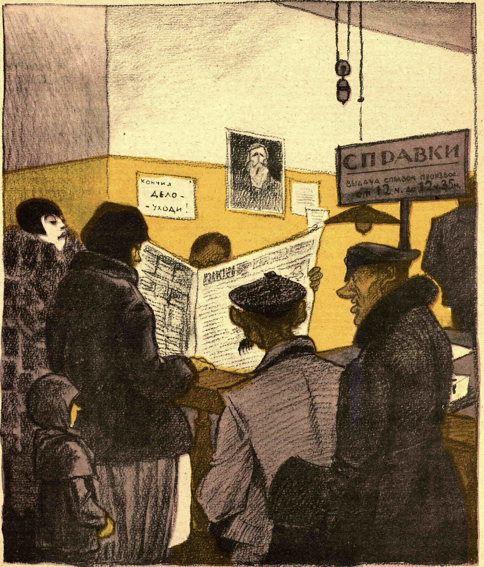
Рис. К. Елисева