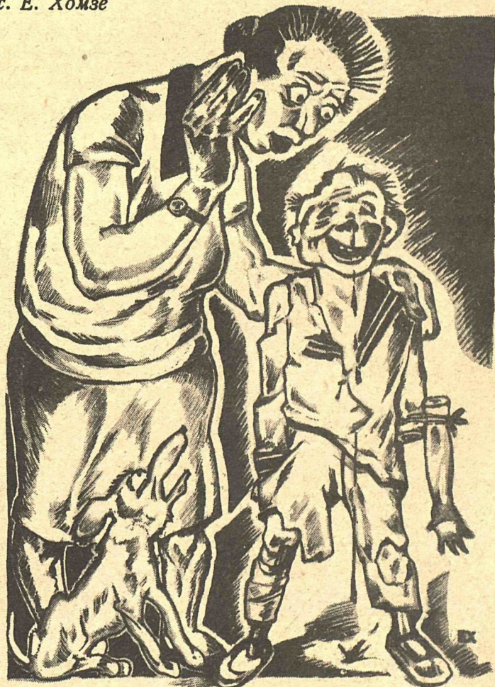
Рис. Е. Хомзе