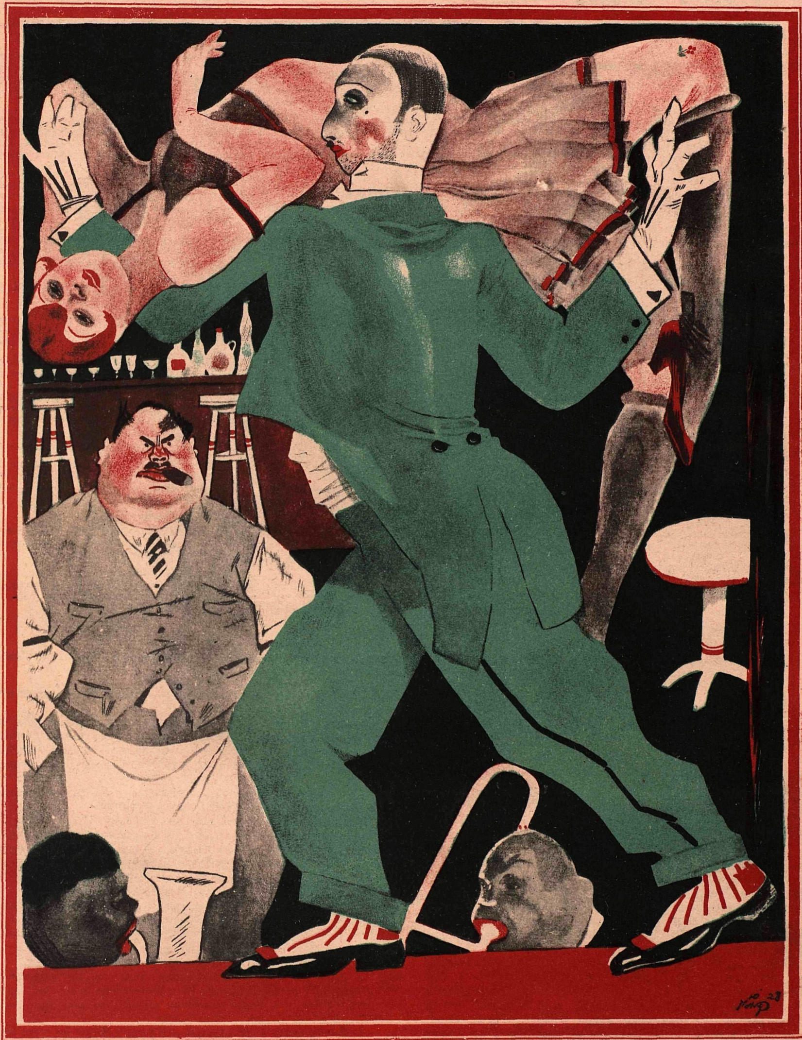
Рис. Ю. Ганфа

РЕЖИССЕР:—Смаку, смаку больше в разложение вносите. Репертком любит разложение, идеологически выдержанное.