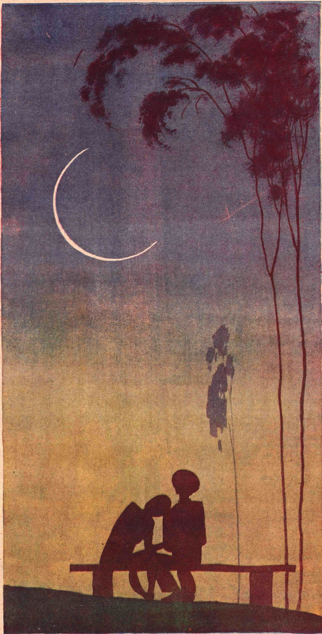
Рис. К. Елисева