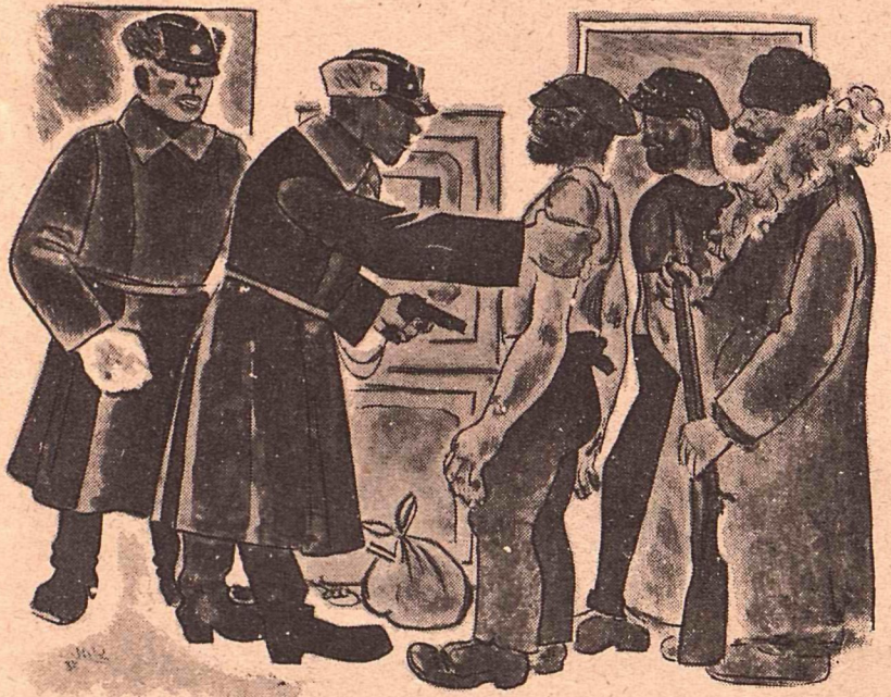
Рис. Д. Мельникова