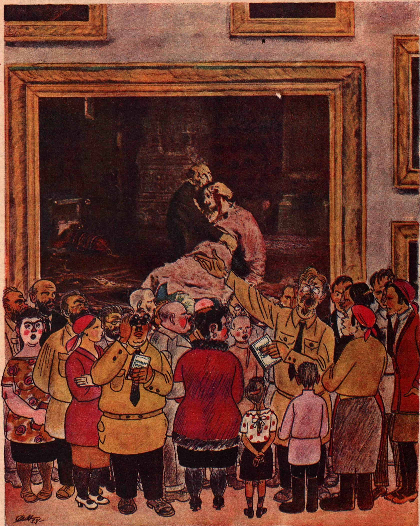
Рис. Д. Мельникова