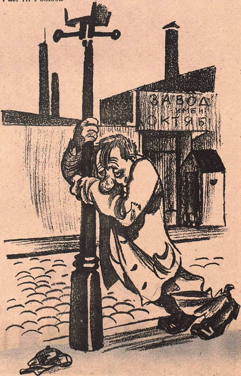
Рис. К. Ротова