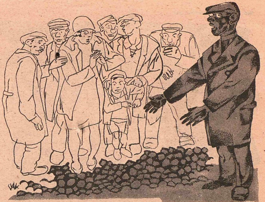
Рис. В. Гин