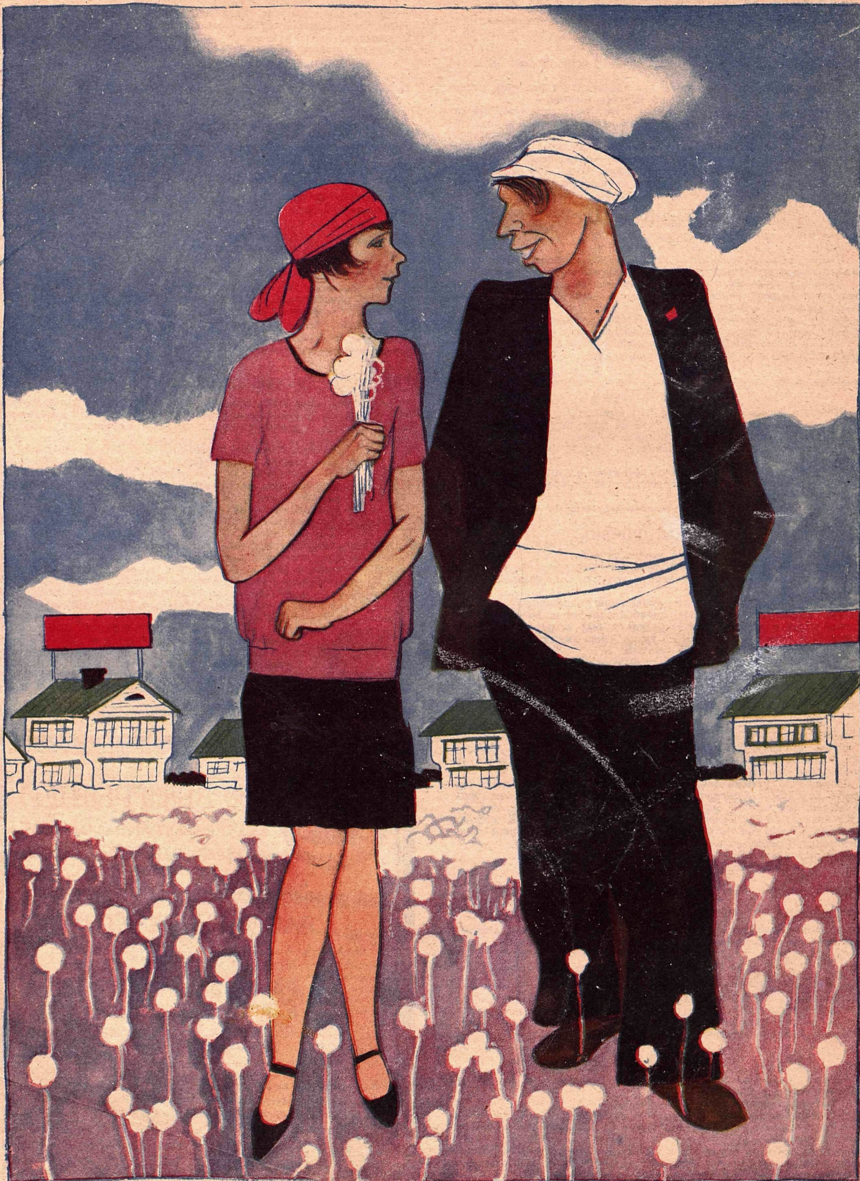
Рис. В. Козлинского

— Не дуй, ради бога! — Одуванчиков жалко?! — Нет, построек,—новые домики ведь!