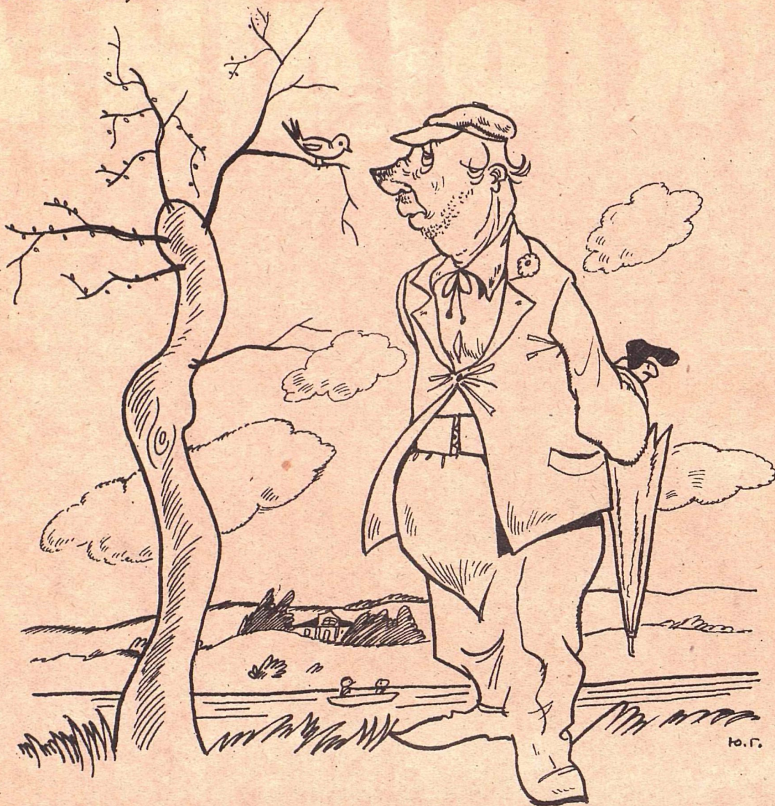
Рис. Ю. Ганфа