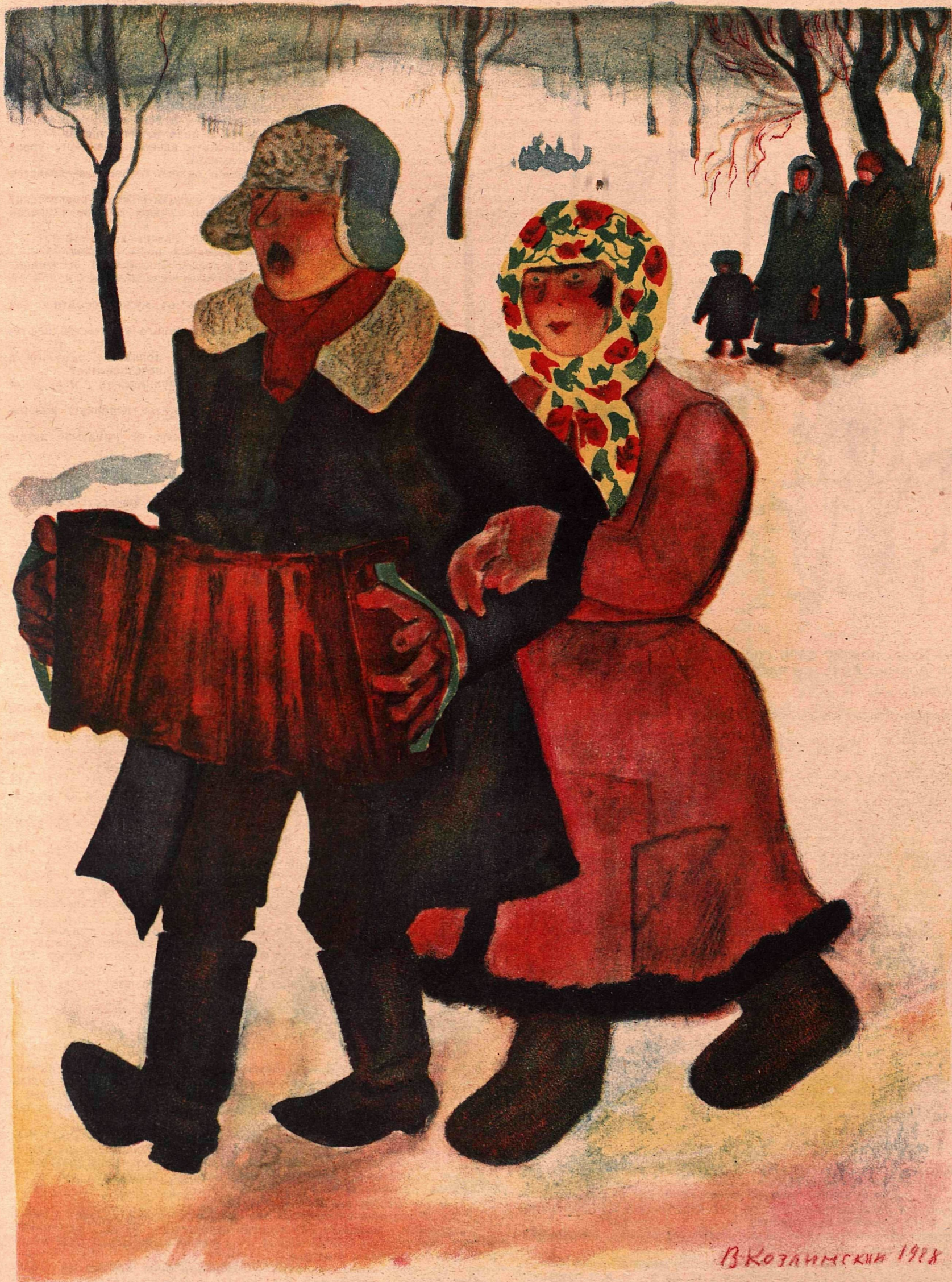
Рис. В. Козлинского