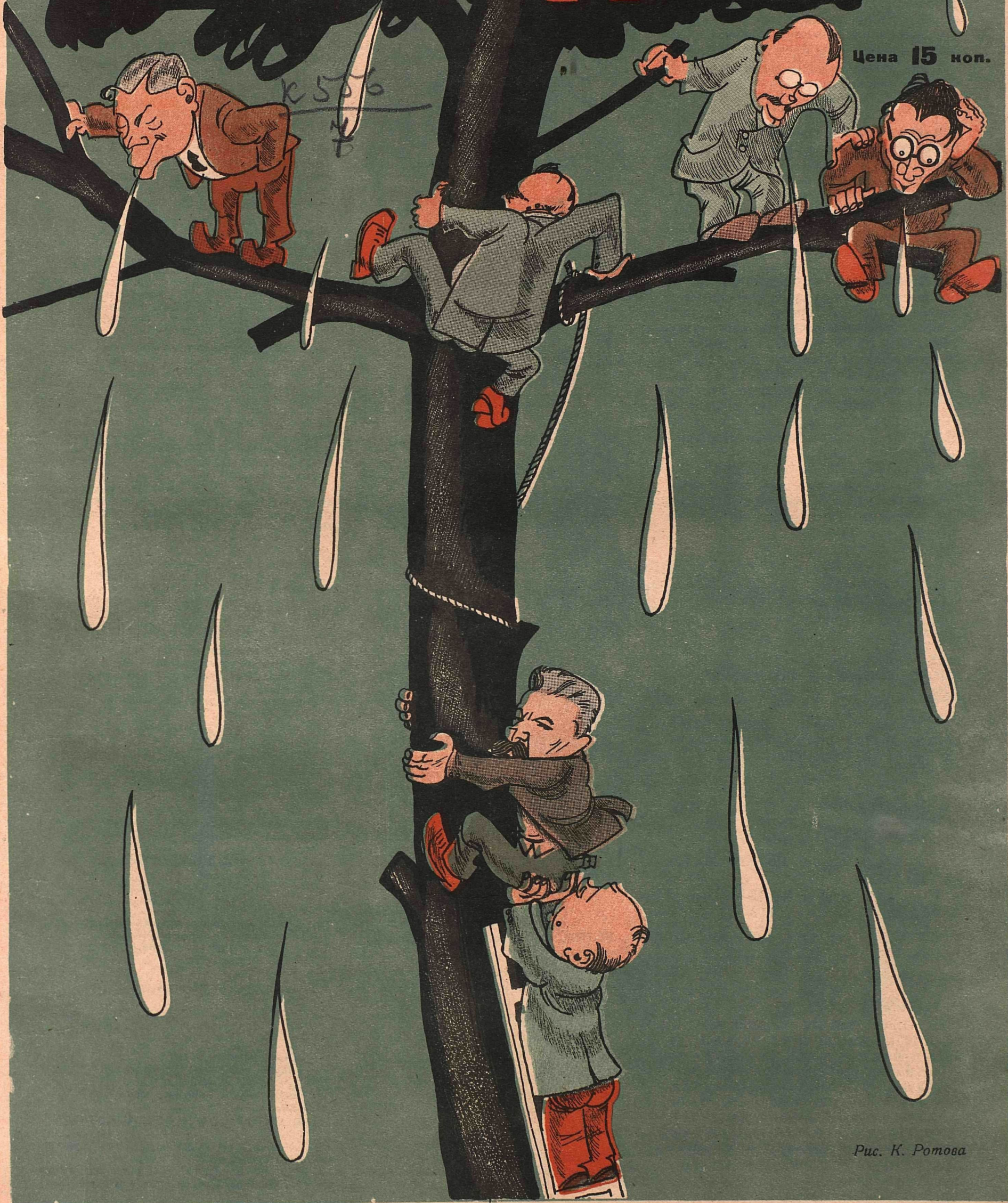
Рис. К. Ротова