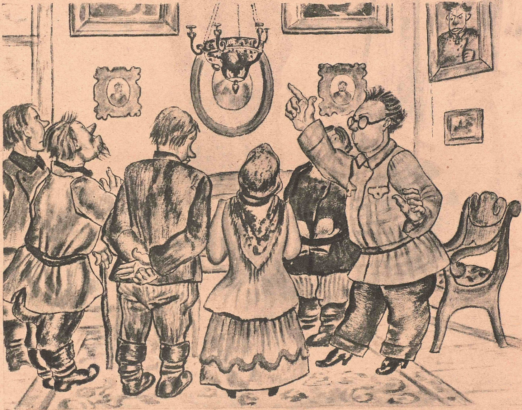
Рис. И. Каликина

Усадьба барона Ливен От станции в двух верстах. Извозчик запросит шесть гривен, Поедет—за четвертак. Усадьба—давно не усадьба, Барон—да-авно не барон. Над домом—воронья свадьба, И нет баронских корон. Усадьба для всех открыта, Ходи и глазей: