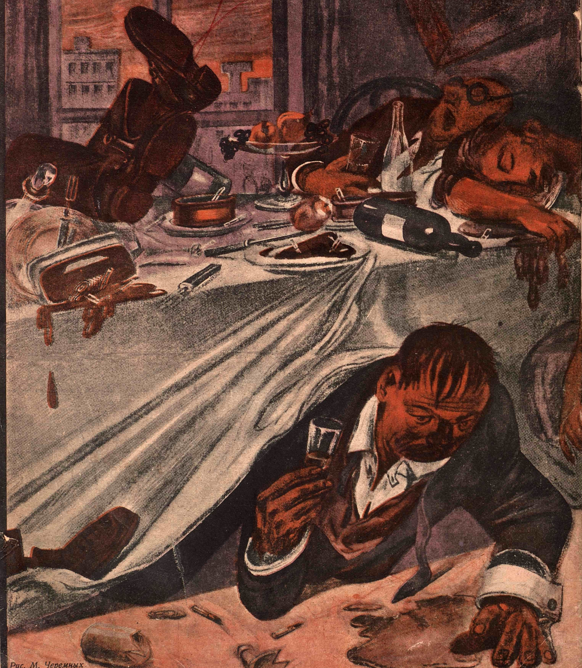
Рис. М. Черемных.