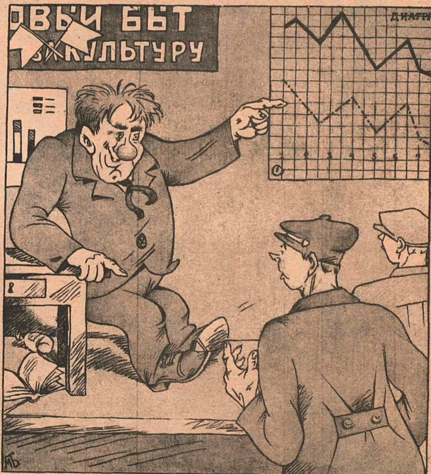
Рис. М. Бабиченко