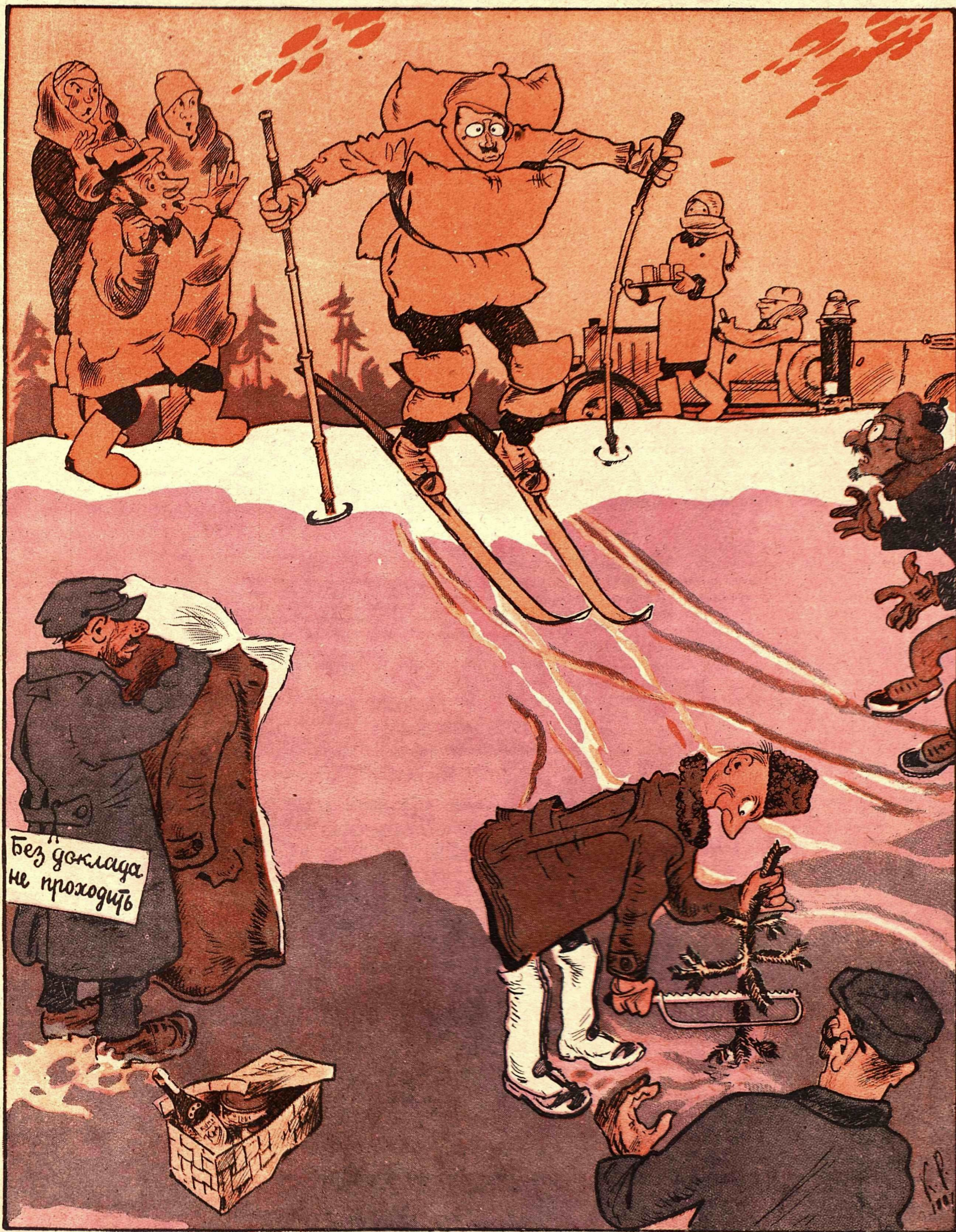
ПЕРВЫЙ ВЫЕЗД НАЧАЛЬСТВА НА ЛЫЖАХ