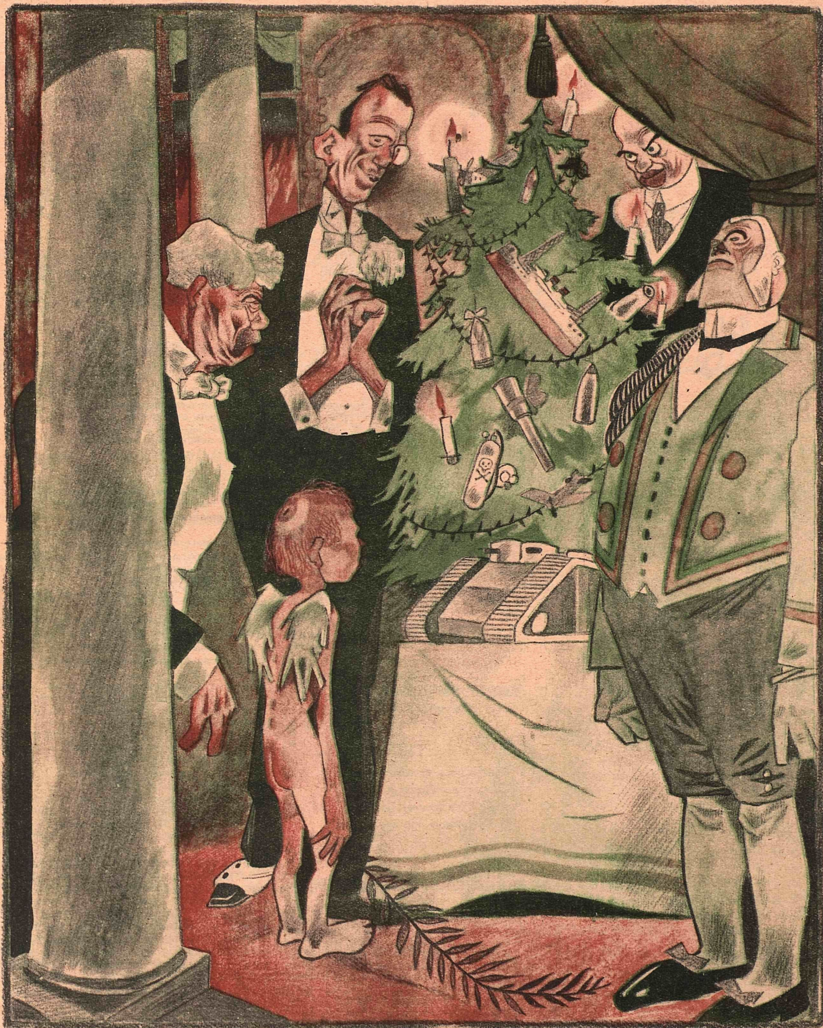
Рис. Ю. Ганфа