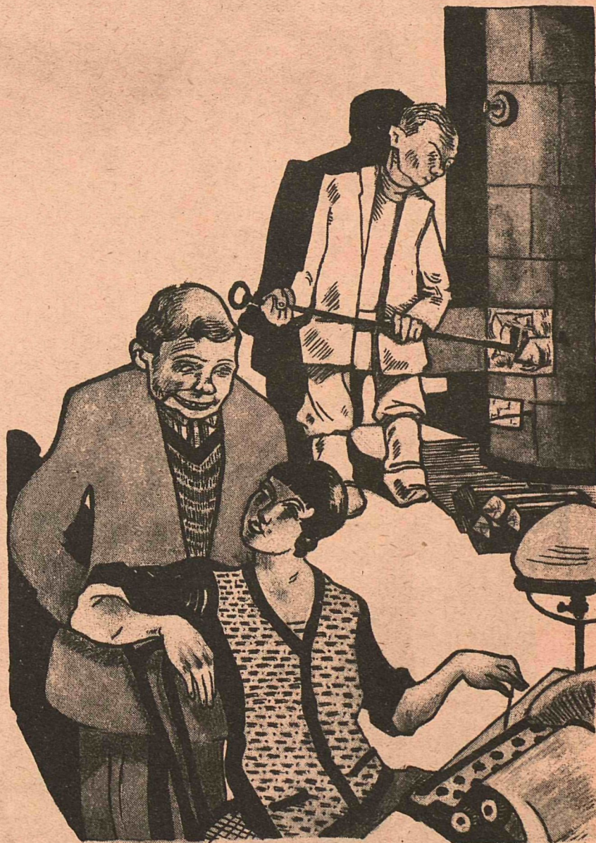
Рис. К. Хомзе

— Видите, Наденька,—и выдвигенца удалось на тепленькое местечко устроить.