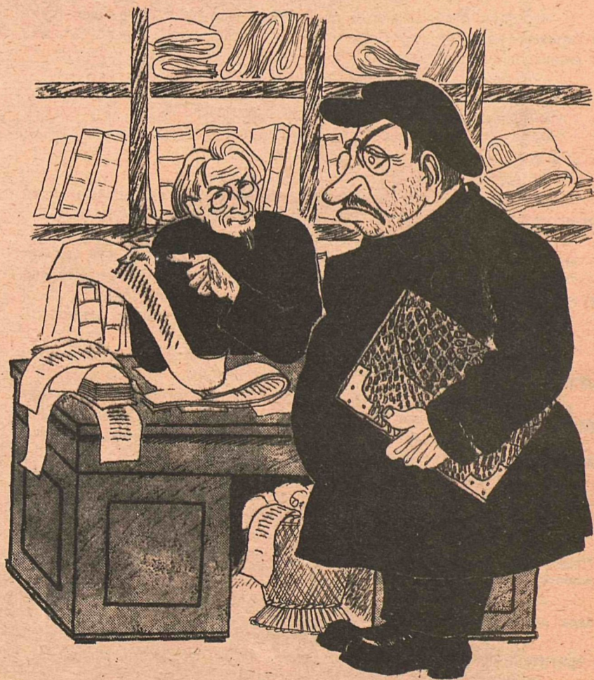
Рис. Д. Мельникова

ЗАВ: — Контр - революцию изволите разводить?! „Бог“ с большой буквы пишете?! СЕКРЕТАРЬ: — Товарищ, это же после точки. ЗАВ: — Никаких идеологически невыдержанных точек допустить не могу! Мы с религией боремся!