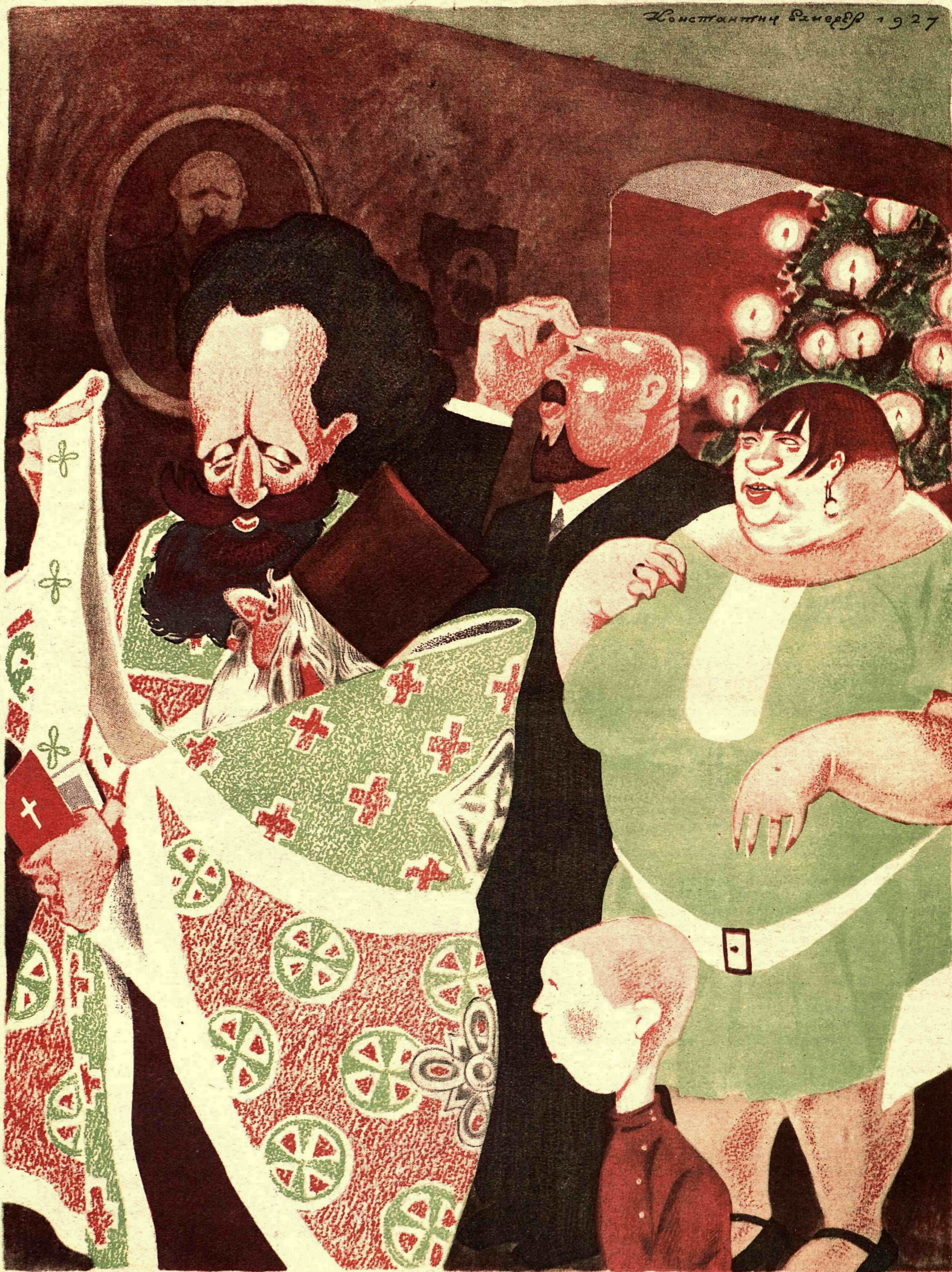
ДИАКОН: — Вразуми, отец: подобает ли многолетие возглашать хозяину?! Он же частник?!