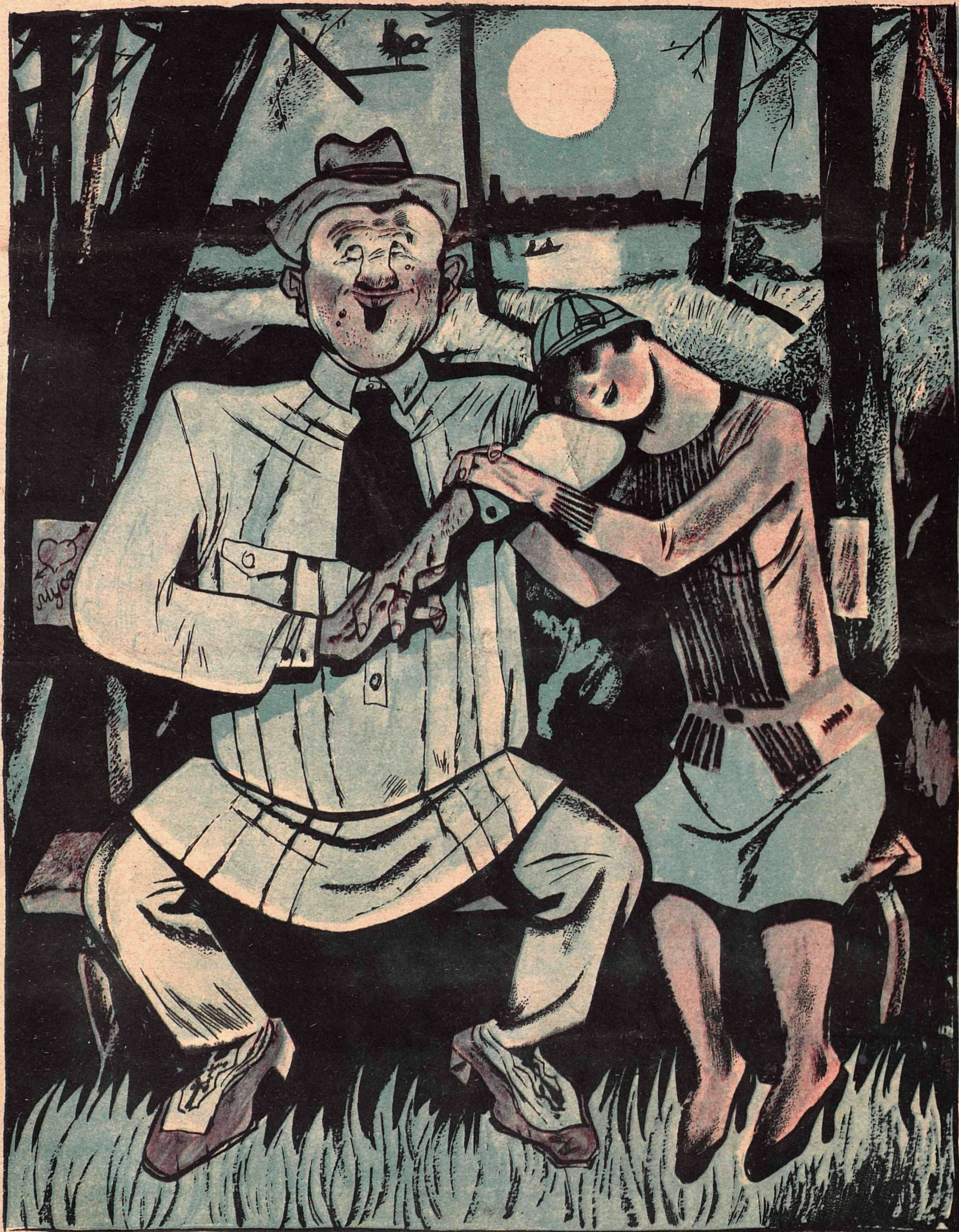
Рис. Ю. Ганфа

— Читатели, небось, подумают, что мы тут для удовольствия сидим, прохлаждаемся в конце октября... А куда нам деваться? Пойти-то некуда: жилкооп квартирку-то только обещал выстроить!