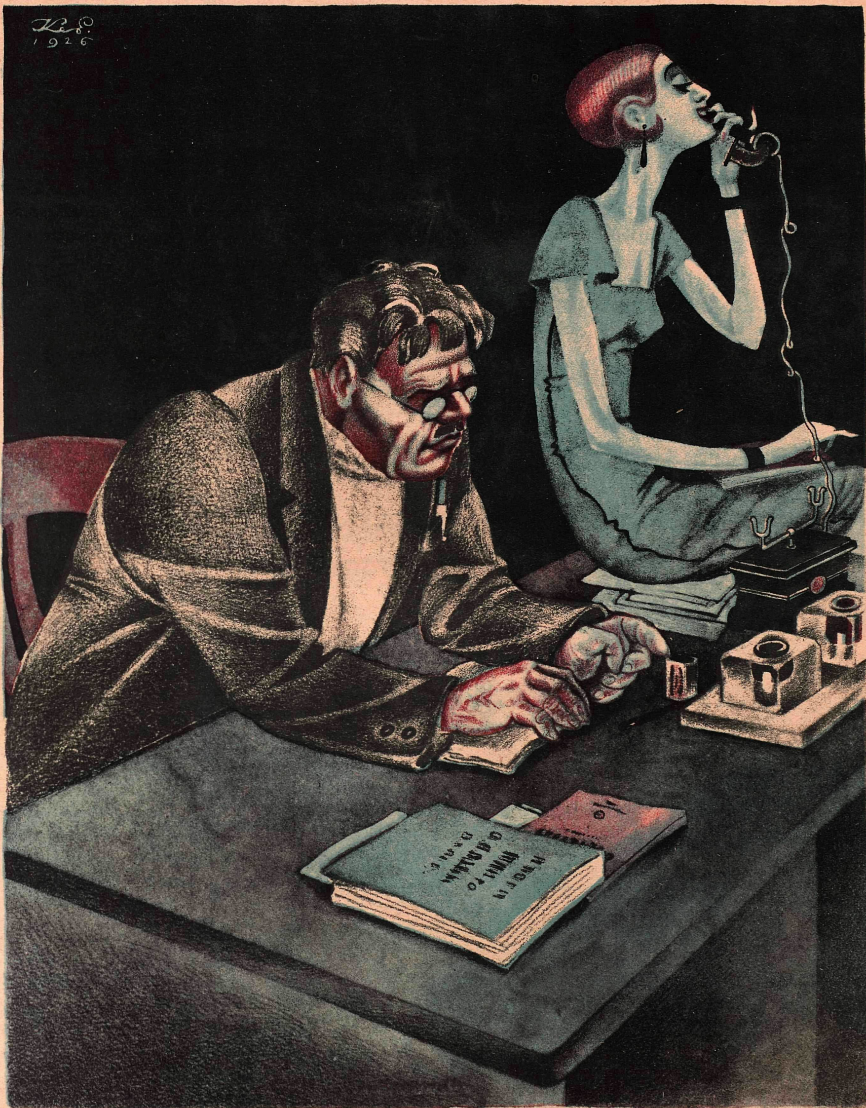
Рис. К. Елисева

— Товарищ Петров?.. Да?.. Ну, вот я и безработная! Берите меня к себе в секретари. Что?.. Хоть завтра! Сергей говорит, что завтра его непременно посадят.