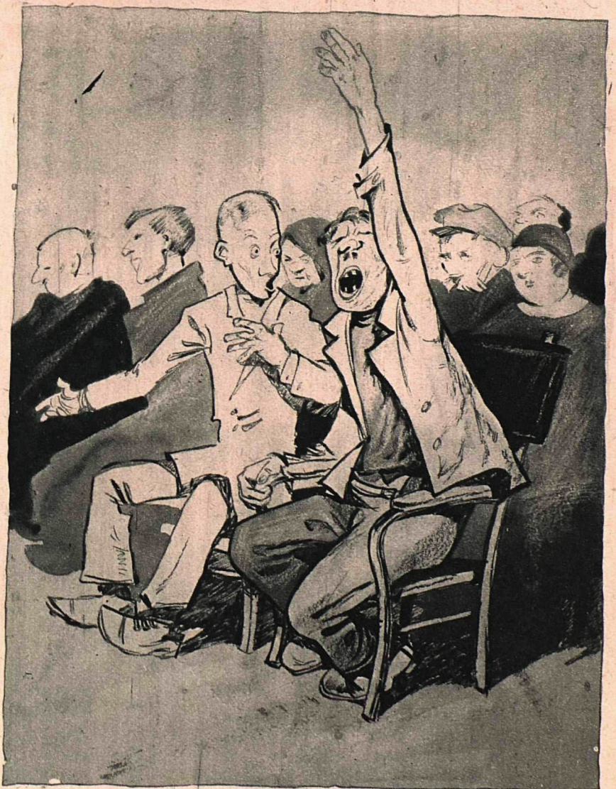
Рис. М. Храпковского

— Чего ты за Тихонова голосуешь!! Ты же с ним в ссоре!!!