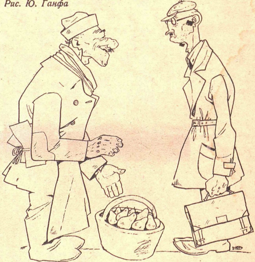
Рис. Ю. Ганфа

— Почем груша? — Гривенник. — А десяток?! — Сорок копеек. — Почему так дешево?! — Да мы на десяток девять штук гнилых кладем-с!