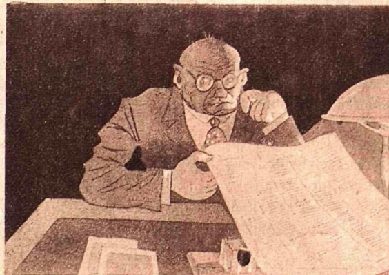
Рис. С. Гершановича

ОПРОВЕРКОР:—Как же я буду опровергать, если во всей заметке ни слова правды нет?!