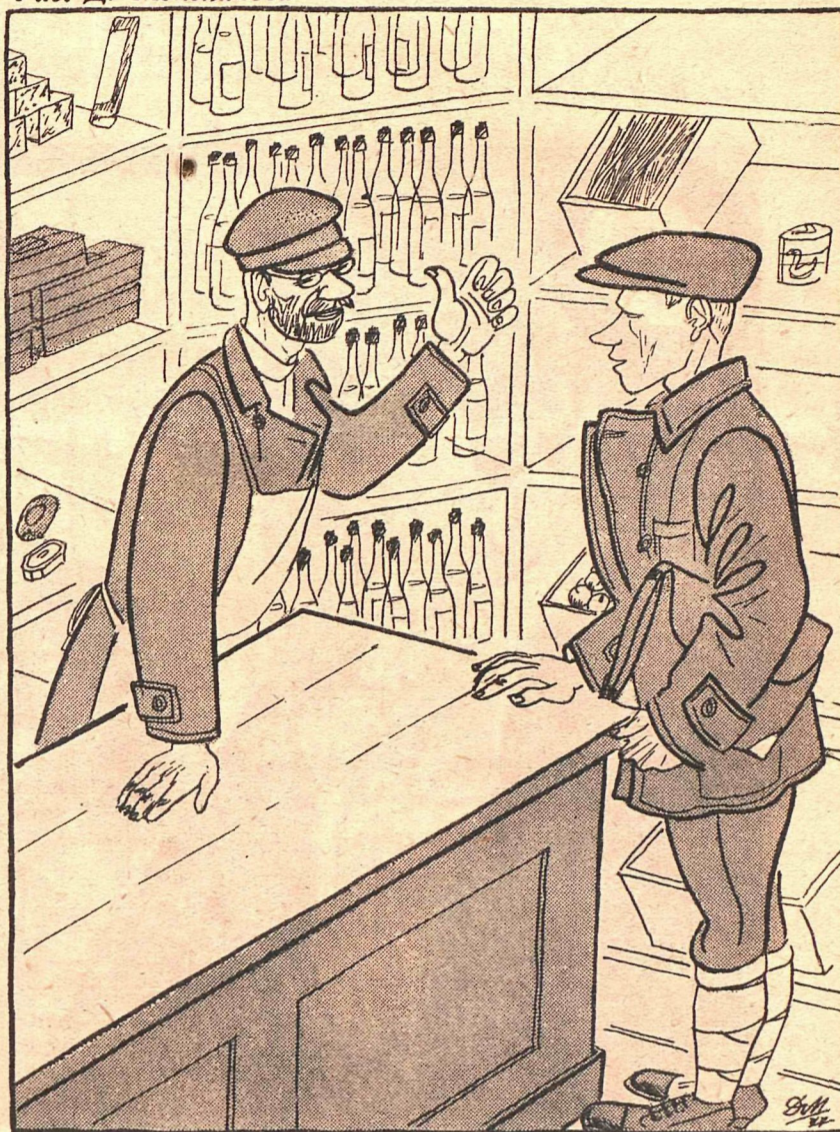
Рис. Д. Мельникова

— Некоторые сомневаются в просветительном значении нашего кооператива. Между же прочим,—обратите внимание,—красный уголок устроили!!