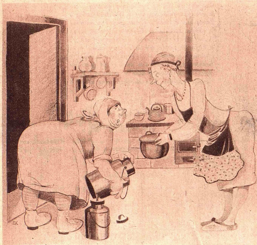
Рис. К. Хомзе

— Свежее ли молоко-то? — Будьте спокойны, гражданочка: все покупатели брюшным тифом переболели, и ни один не помер!!!