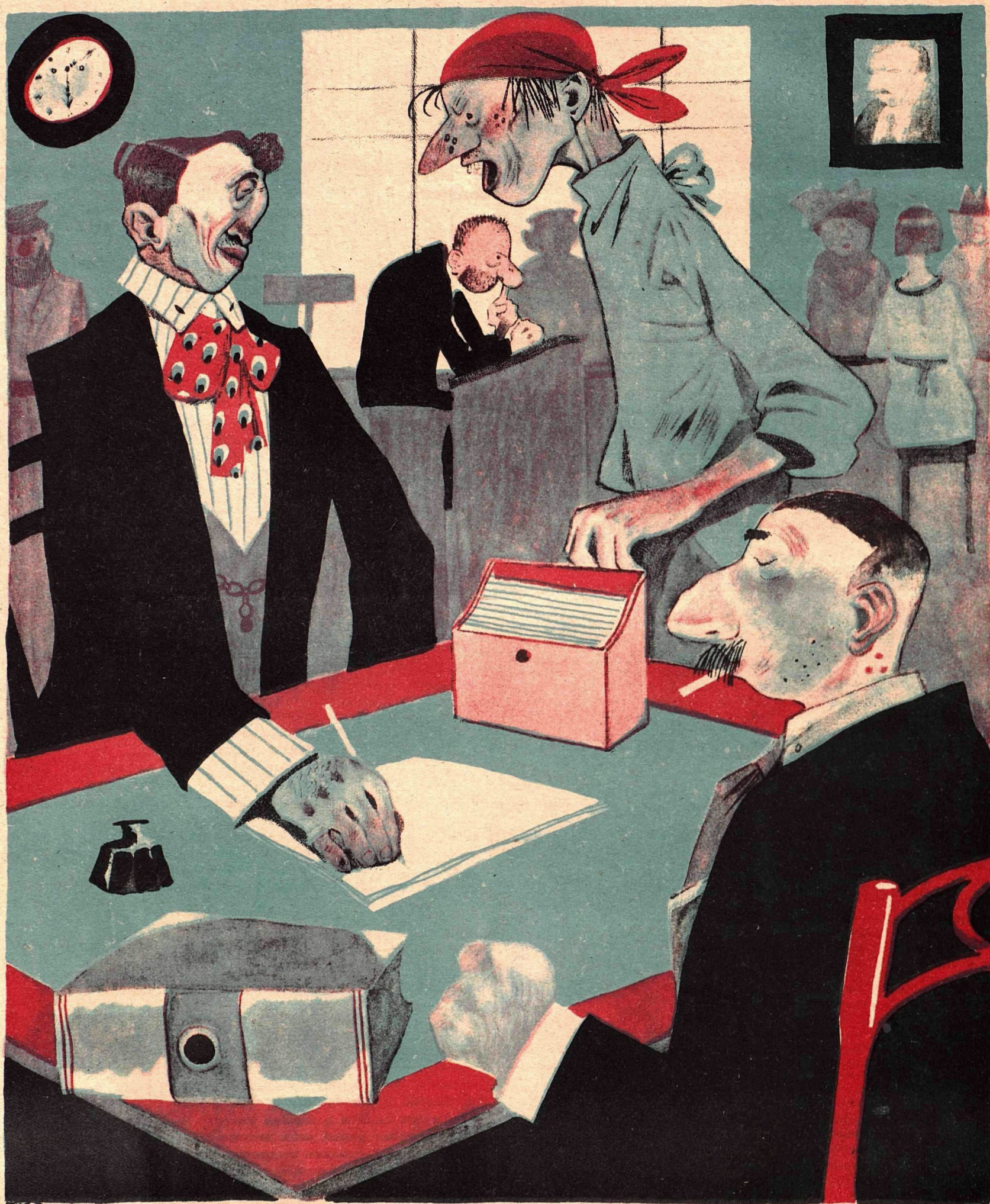
Рис. Ю. Ганфа

— Товарищ уборщица, принесите, пожалуйста, нам чаю.. — Что я вам выдвиженка что ли чай-то разносить?! У меня свое дело есть!