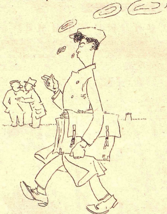
Рис. М. Храпковского

— Обратите внимание,—с подполь-ным стажем! — Такой молодой?! — Да. У него подпольный стаж уже нынешний,—в подпольной типографии с оппозицией работал.