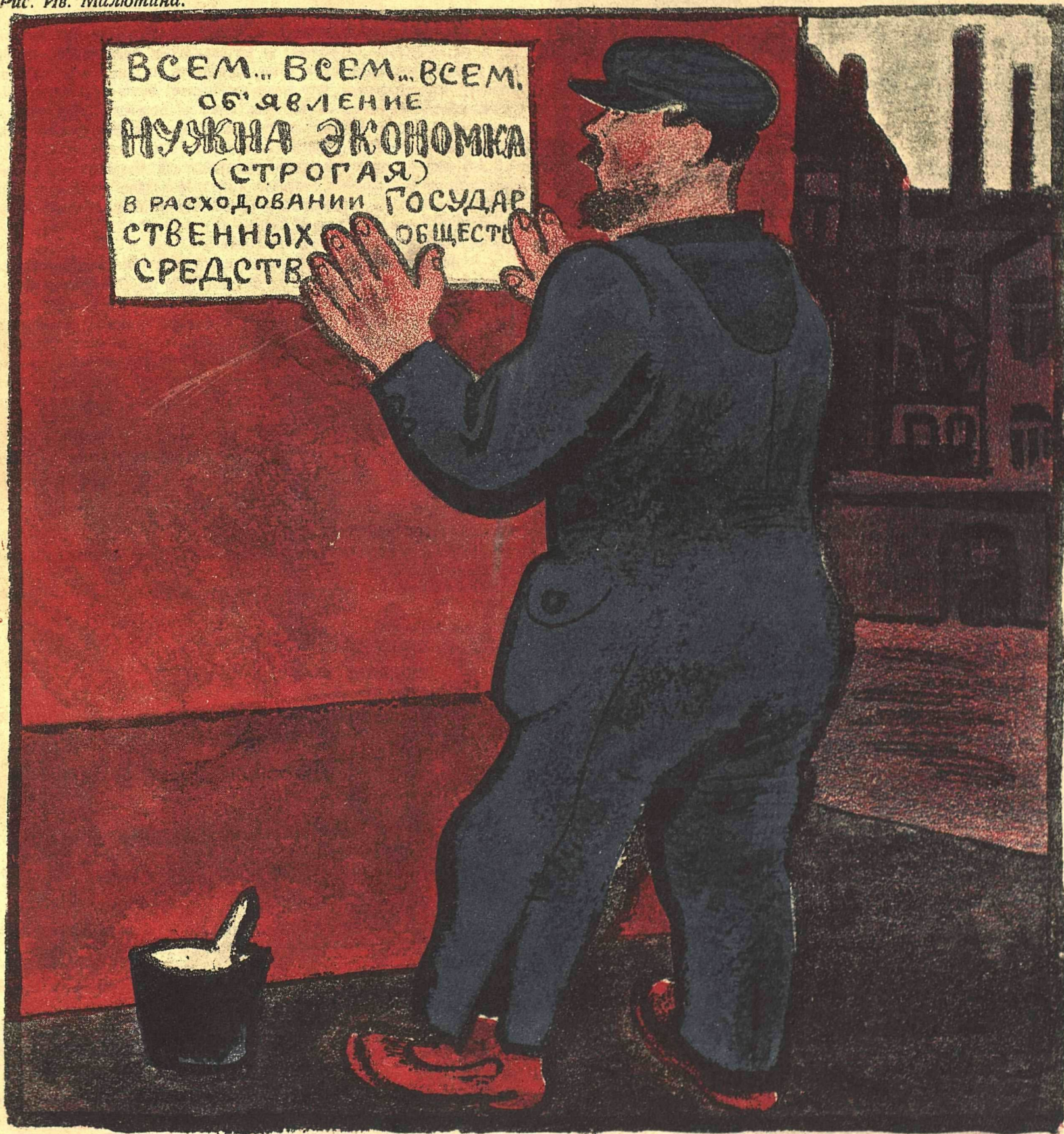
Рис. Ив. Малютина.

Вот объявление, которое „Крокодил“ помещает на первой странице совершенно бесплатно и с величайшим удовольствием.