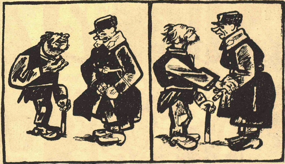
Рис. И. Малютина.

По постановлению Моссовета, за поладу милостыни граждане подвергаются штрафу».