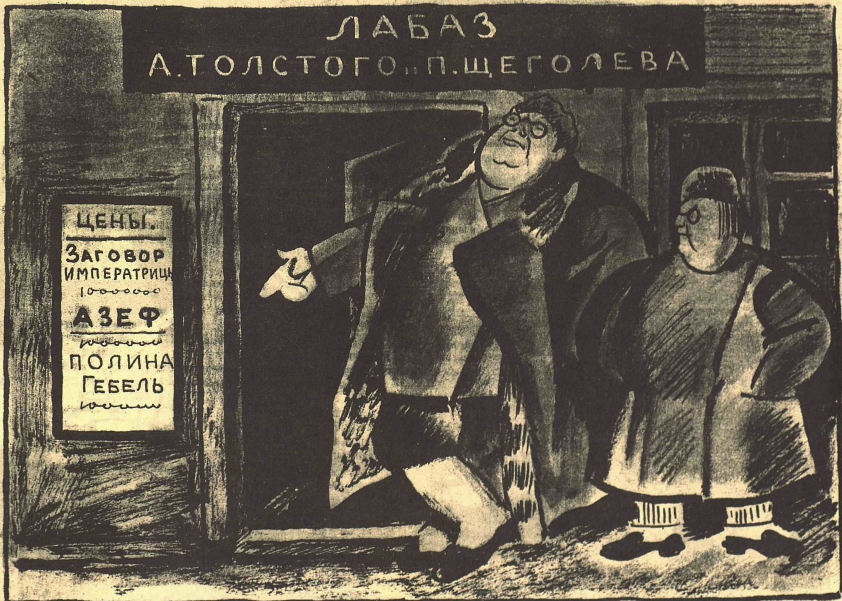
Рис. А. Радакова.

— Пусть другие там занимаются художественной литературой, — а мы открыли свое хлебное дело. Оно гораздо прибыльней!