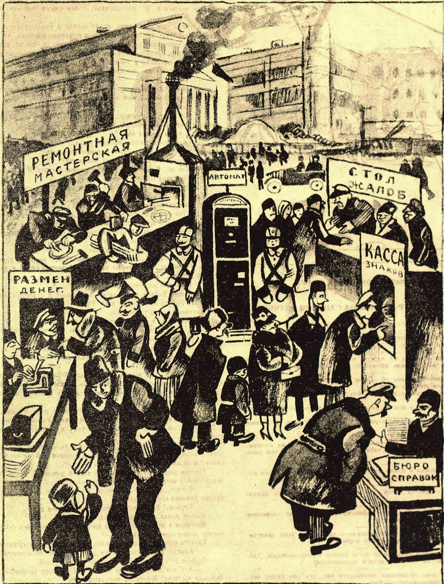
Рис. А. Радакова.

В целях экономии времени и сокращения ненужных штатов для удобства потребителей на одной из самых людных площадей был поставлен автомат, снабжающий население предметами насущной необходимости (шоколад и папиросы). Но... дерзкие воры пытались похитить автомат—и пришлось поставить около него постоянную дневную и ночную стражу. Автомат часто ломался. И чтобы не возить его в ремонт (перевозка стоит слишком дорого), решено было открыть специальную походную ремонтную мастерскую. Не все знали, что именно продается автоматом и в какие часы он работает—и вот явилась насущная необходимость в справочном бюро. Для размена бумажных знаков на годное для автомата серебро были открыты специальные кассы. Но так как все открытые при автомате учреждения работали не всегда исправно,—был организован стол жалоб. Теперь все предприятие, наконец, налажено. И специальный статистический отдел при автомате зафиксировал, что автомат ежедневно продает 4 коробки «Явы» и две плитки шоколада!