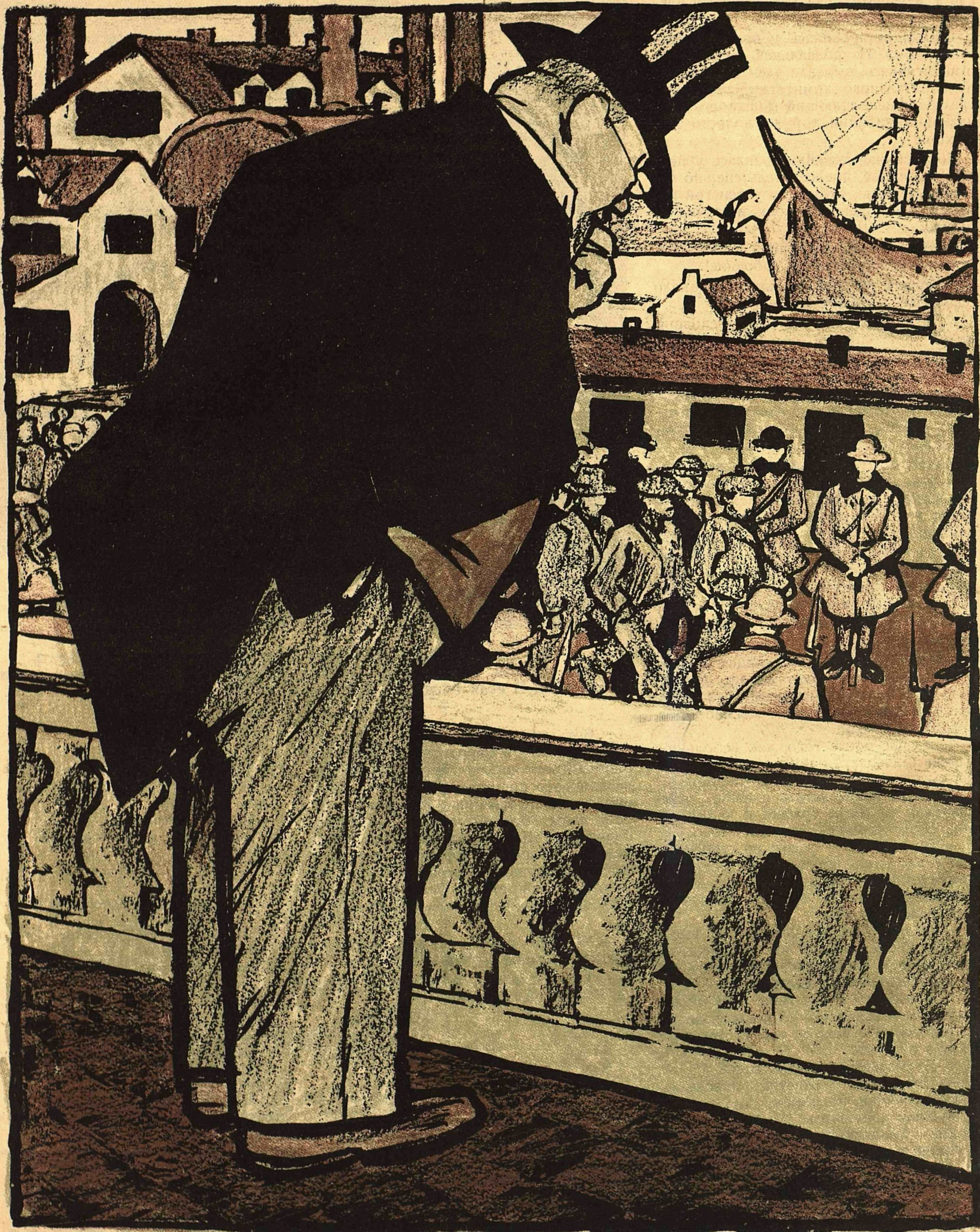
Рис. Ив. Малютина.

КАПИТАЛИСТ: —Не понимаю! Кажется, охрана труда поставлена у нас превосходно, а катастрофы все растут. Придется еще увеличить штат полиции.