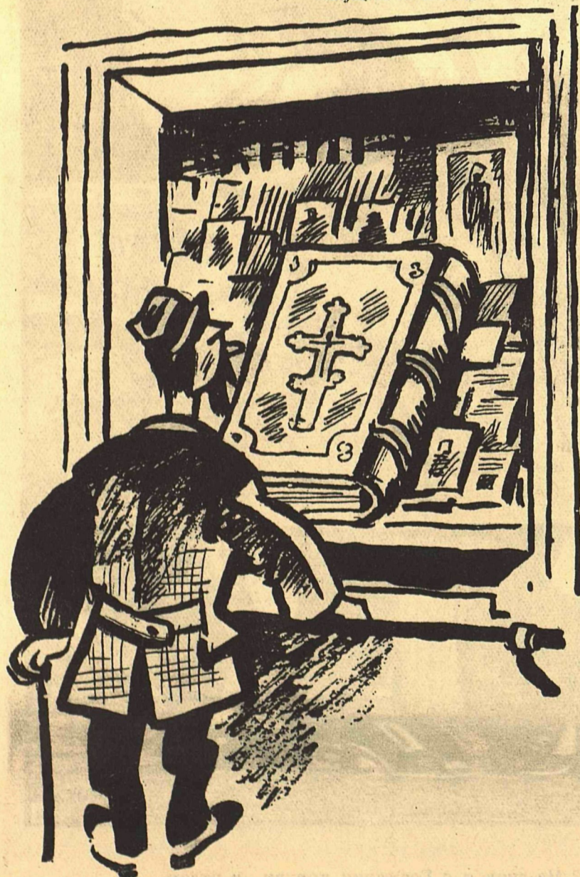
ГЕРМАНСКИЙ МЕНЬШЕВИК:—Напрасно нас обвиняют в религиозных предрассудках. Мы тоже поставили на библии крест.

Издательством германских с.-д. выпущена ... библия.