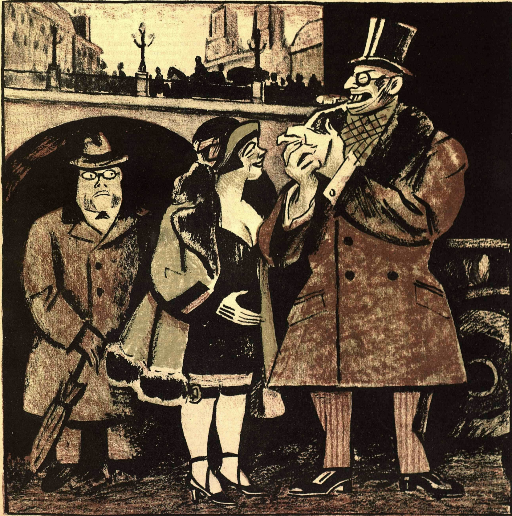
Рис. А. Радакова.

ФРАНЦИЯ (АМЕРИКЕ): — Ну, что вам стоит дать мне взаймы? На-днях я с Германии получу—и отдам.