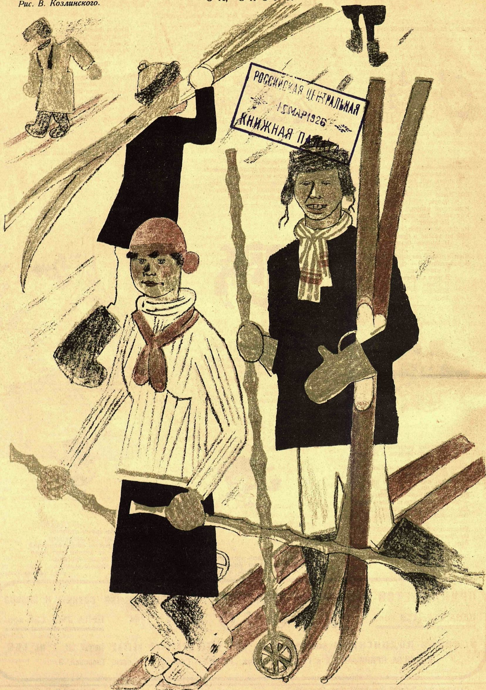
— Ты знаешь: месяца через два разрешится вопрос о посылке нас на международные лыжные состязания. И, кажется, не позже июля мы, наконец, поедem.