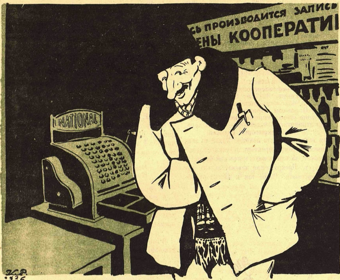
Рис. К. Елисеева.

— Кооперативные заправили ташут из кассы общественные деньги, а простофиля, член кооператива, не обращает на это внимания. Где этот простофиля?