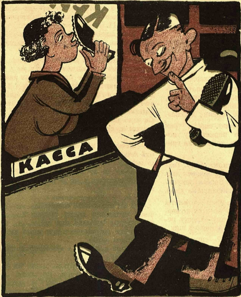
Рис. К. Ротова.

ЕСЛИ БЫ ПО ПРИМЕРУ РЕЗИНОТРЕСТА СВОЮ ПРОДУКЦИЮ СТАЛИ ВЫДАВАТЬ СЛУЖАЩИМ ДЛЯ ПРОБЫ ВИНТОРГ, ГОСБАНК ИЛИ ТРЕСТ ПОХОРОННЫХ ПРИНАДЛЕЖНОСТЕЙ.