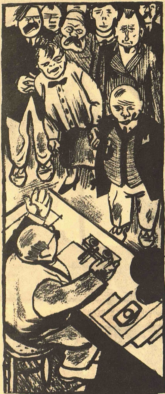
Рис. И. М.

УПРАВДЕЛ:—Вот что, граждане! В виду мебельного кризиса вы будете сокращены, ибо ведь вы же были здесь только для мебели.