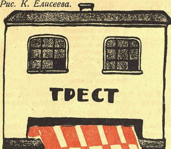
Рис. К. Елисева.