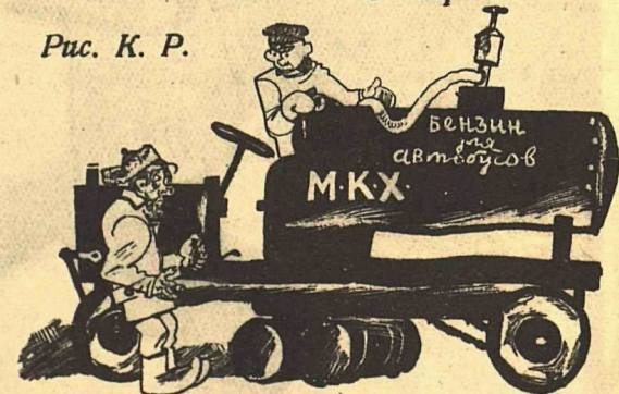
Рис. К. Р.

— Эй, гражданин! Здесь, што ли-ча, автобусы бензин получают?