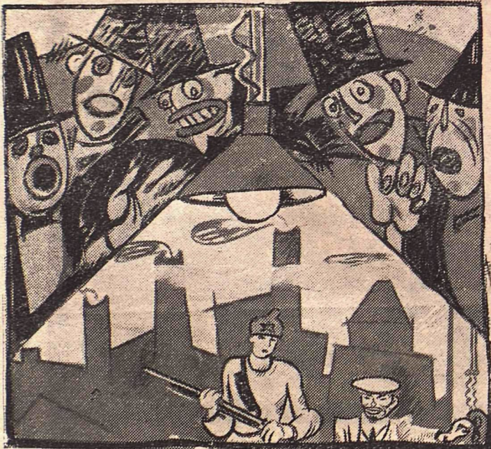
ЛЕНИН (красноармейцу):— Смотри, эта падаля боится света так же, как и твоей винтовки.