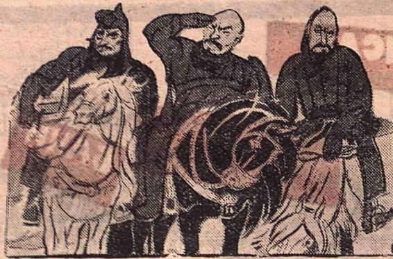
Тов. Троцкий. Тов. Ленин. Тов. Чичерин.