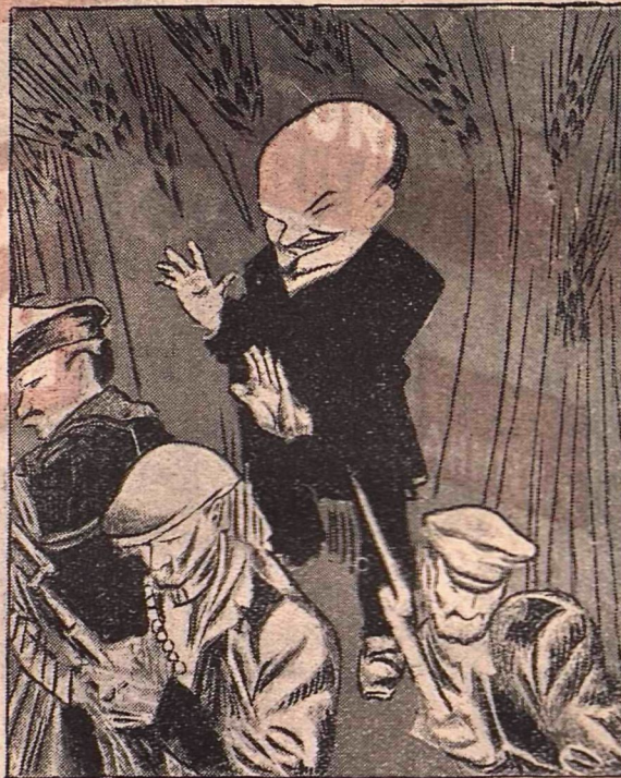
ЛЕНИН: — Довольно отступать.