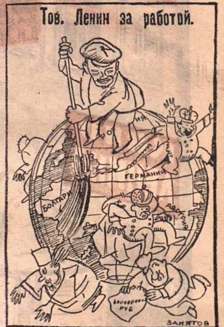
Тов. Ленин за работой.