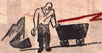
Рис. К. Ротова.