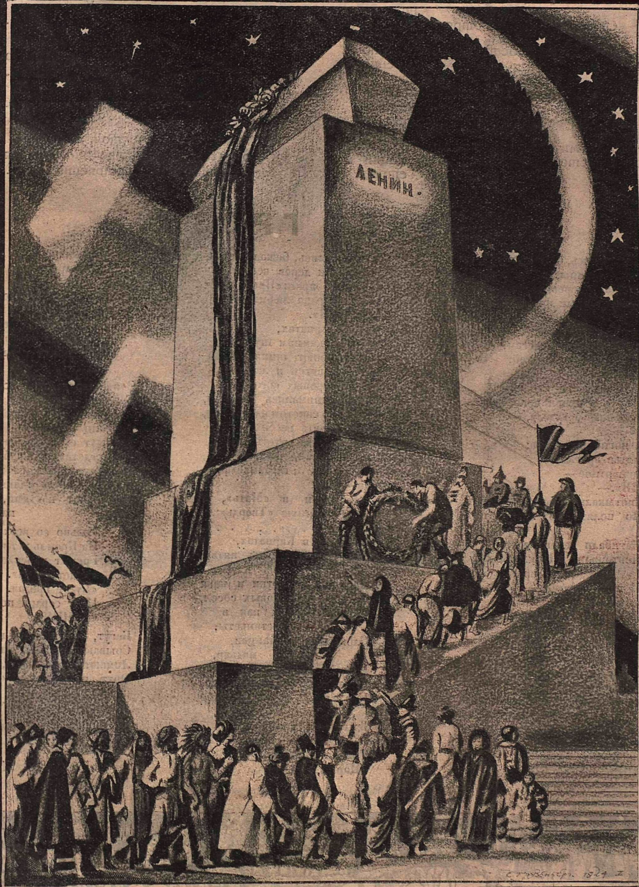
Рис. С. Грузенберга.