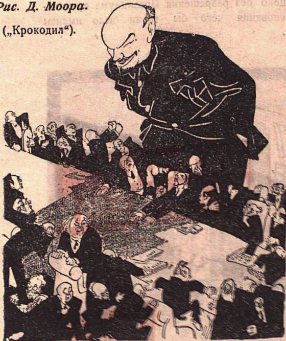
Появление Ленина на всемирной конференции.