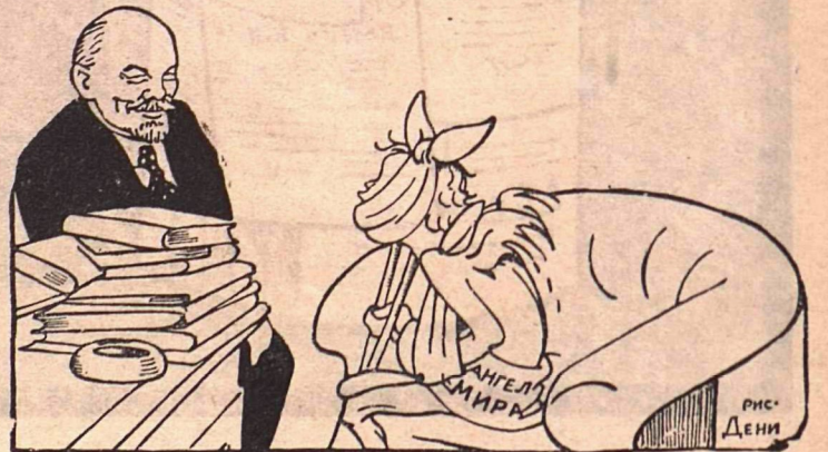
АНГЕЛ МИРА: — Товарищ Ленин, я без вас в Геную не поеду. Довольно!.. Попито моей кровушки!..