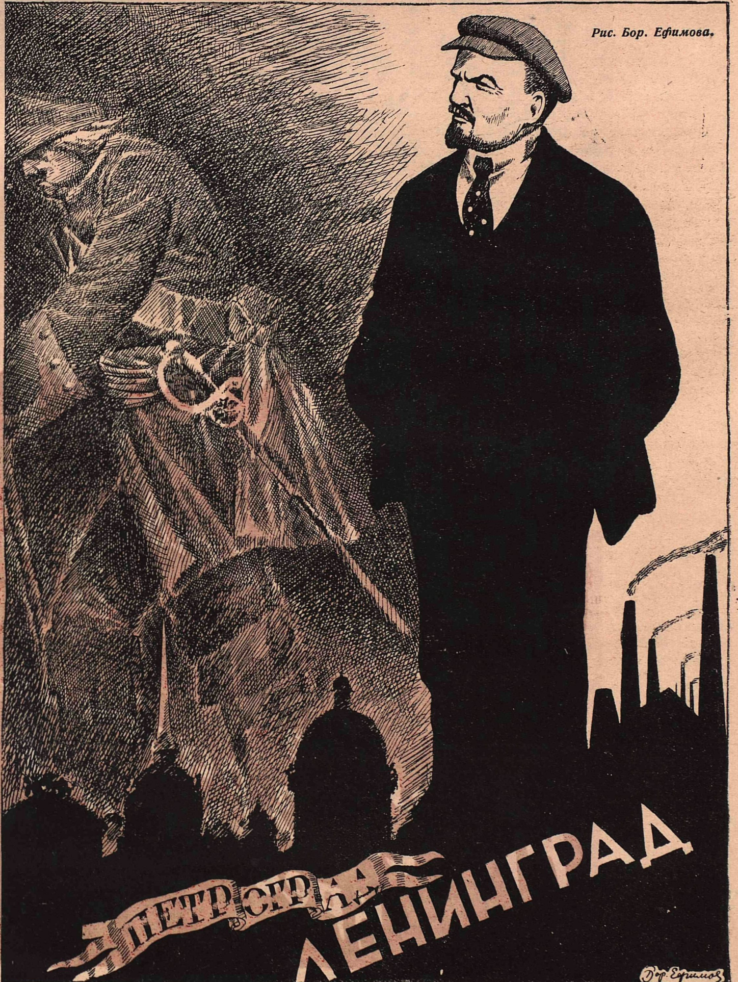
Рис. Бор. Ефимова.

С одной стороны, самый трезвый реализм, срывание всех и всяческих масок; с другой стороны, проповедь одной из самых гнусных вещей, какие только есть на свете, именно: религия—стремление поставить на место попов на казенной должности, т.-е. культивирование самой утонченной и потому особенно омерзительной поповщины“.