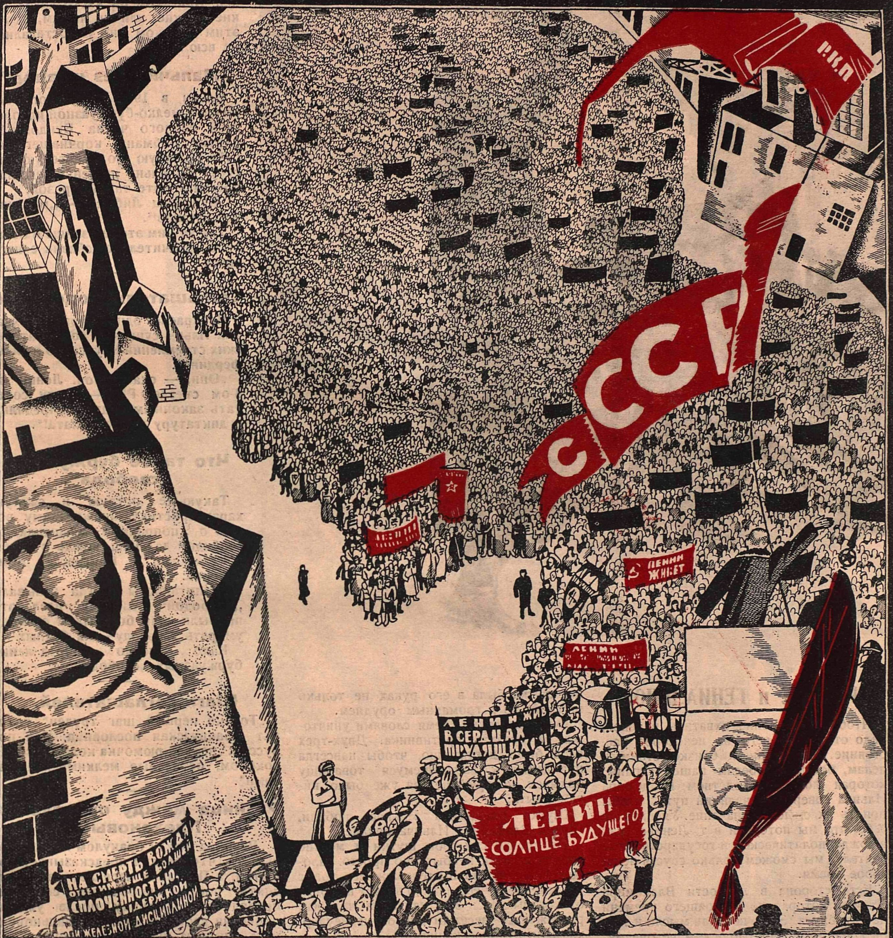
Рис. К. Ротова.

„Ленин умер... Но Ленин жив в миллионах сердец. Он живет в прибое человеческих масс.... Сотни тысяч учеников Владимира Ильича крепко держат великое знамя. Миллионы сплываются вокруг них“.