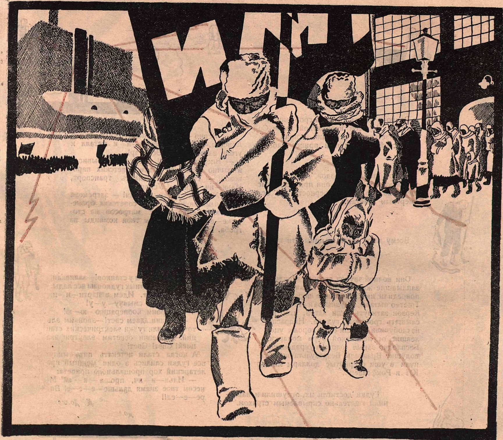
Рис. К. Ротова.