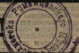
Рис. М. Черныш.