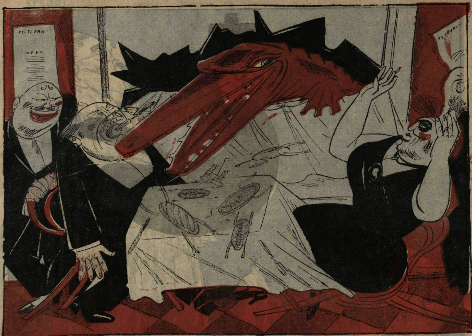
рис. М. Мелиникова.

КРОКОДИЛ: — На двери ресторана я прочел, что тут есть кушанья на всякий вкус. И правда—даже для меня тут пищи много... А глотну-ка я вот эту парочку под червонным соусом!..