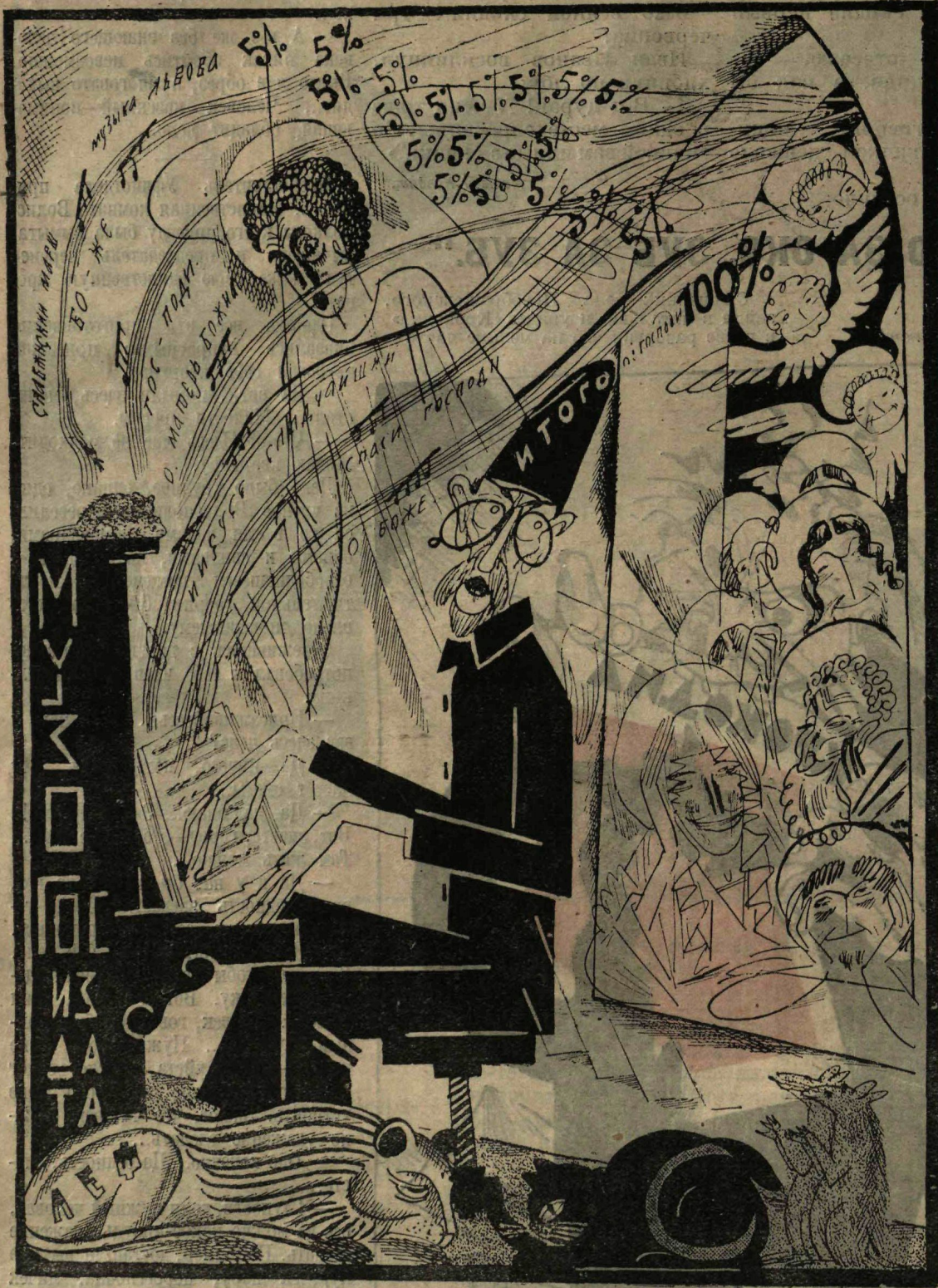
... Святцы-Госиздатцы :