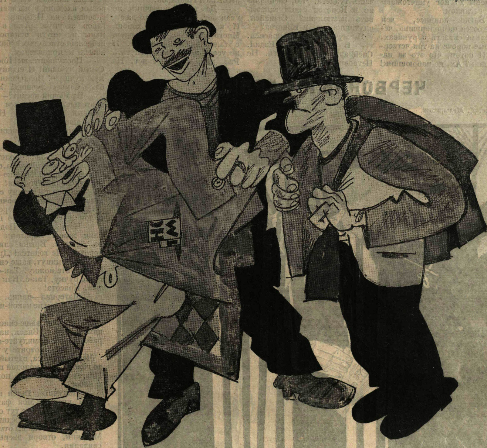
Рис. Ив. Малютца

МИЛЮКОВ: —Послушайте, милые, меня уже раздевали... там, в России, перед октябрём!..