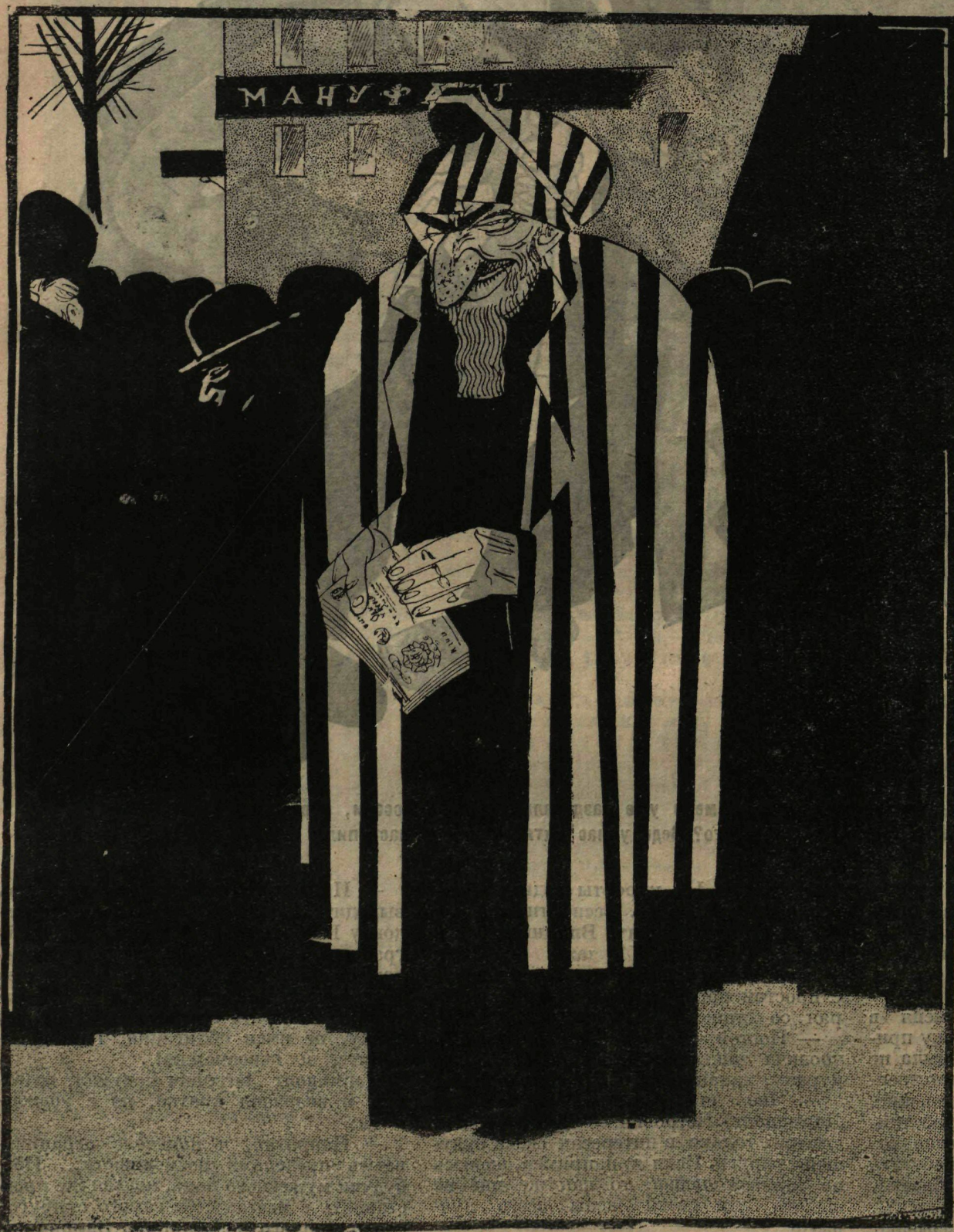
Рис. Д. Мельникова.

РАВВИН: — Сегодня один прихожанин в синагоге сказал, что я разменялся на мелочи. Что-же, это не так плохо. Я за обмен червонца на мелочь 500 рублей беру!..