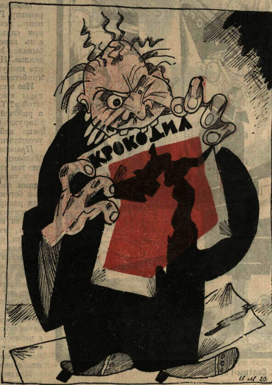
Рис. Ив. Малюткина

ПО П: — Этот проклятый Крокодил грызет меня из номера в номер. Ну, я тоже ему штучку придумал: жуду тоже грызть его номер за номером!..