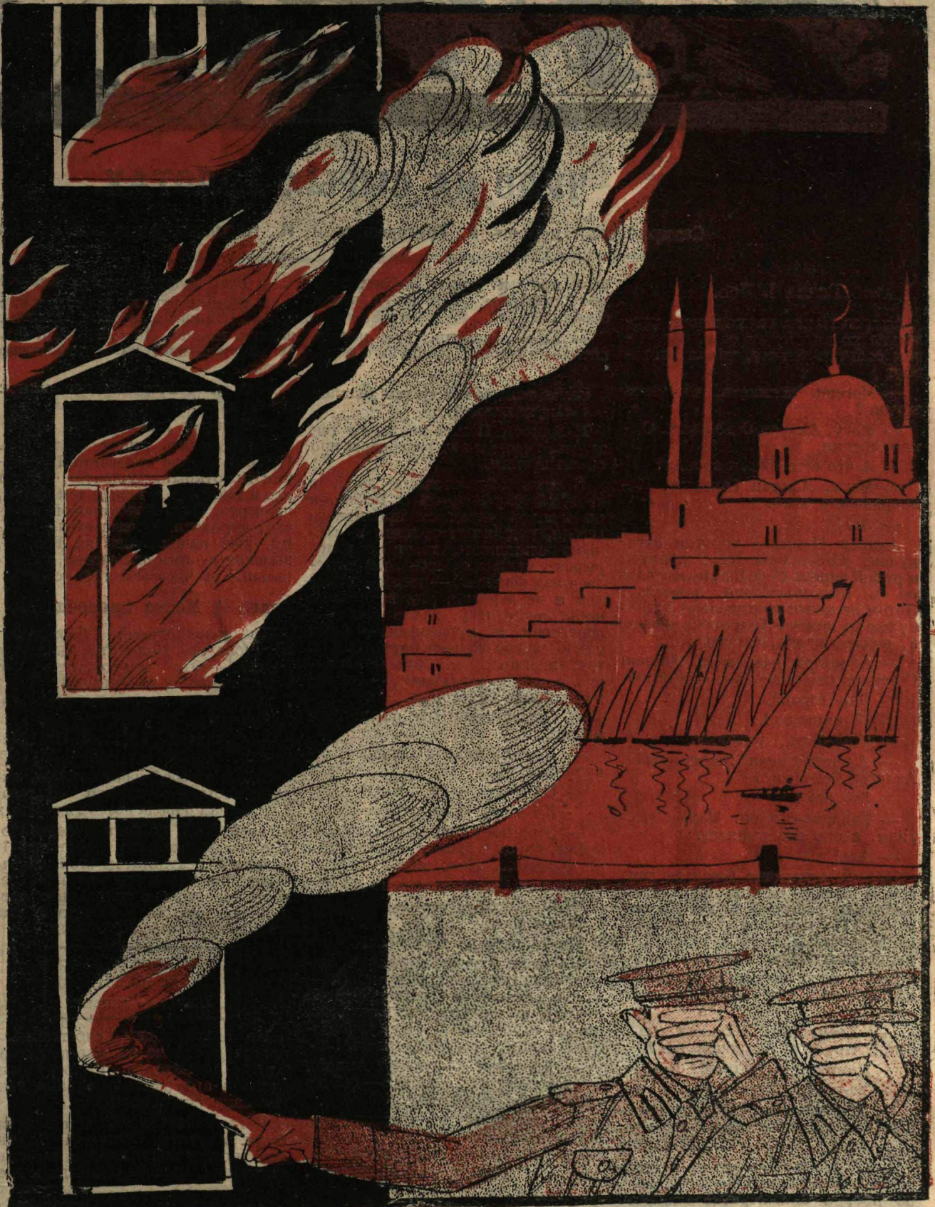
Рис. Л. Мельникова.

СОЮЗНЫЙ ОФИЦЕР: — Я почти уверен, что эти наглцы найдут связь между пожаром дворца и нашим уходом.