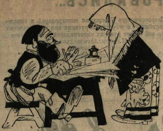
Есть у меня государственное дело—прохладиться с бабой.