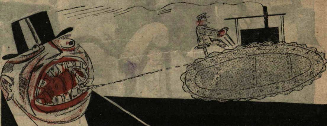
Рис. Д. Мельникова.

треста посылает в газету «Вятская Правда» такое обьявление: