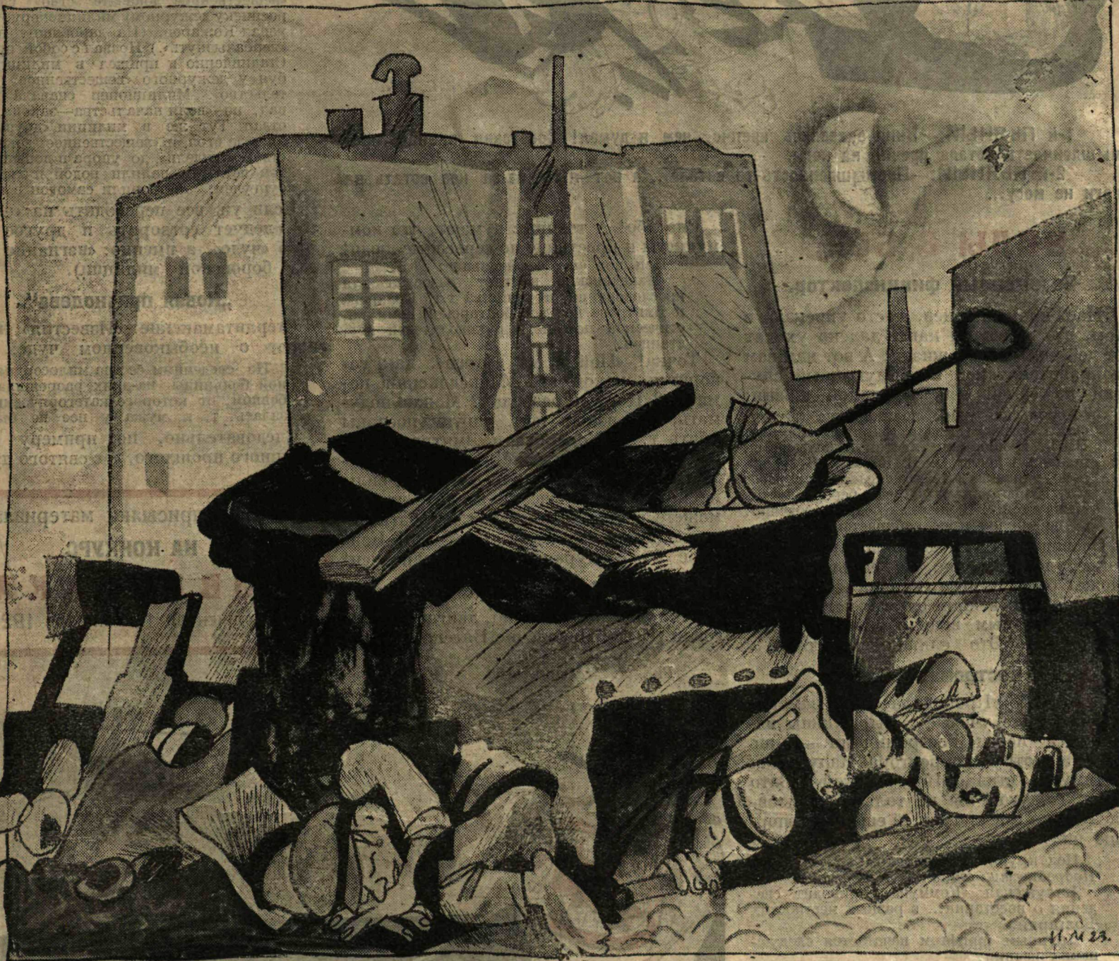
Современные «котроки в печи огненной».