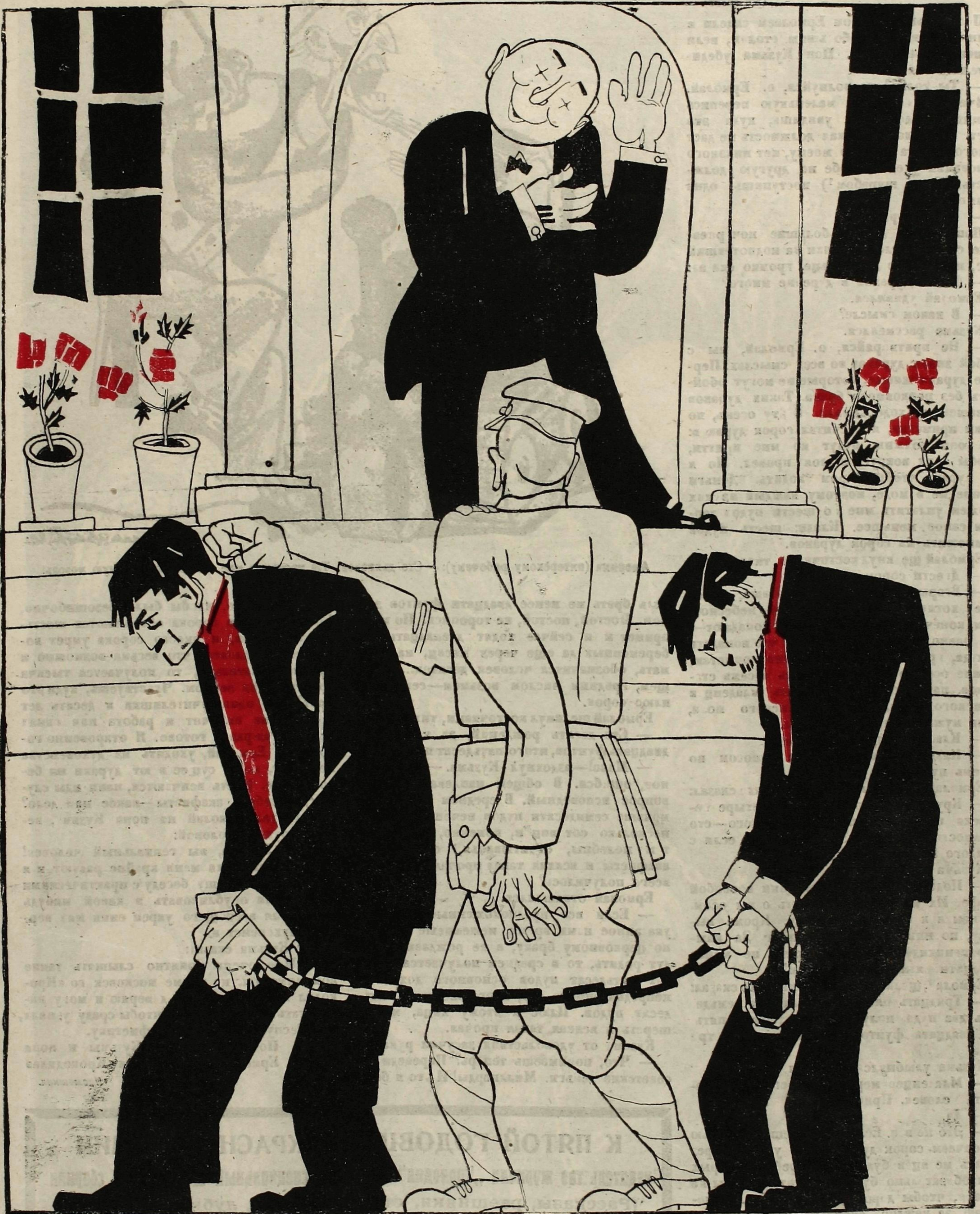
Рис. Д. Моора.

Премьер министр Латвии начал свою деятельность с арестов коммунистов. (Из газет)