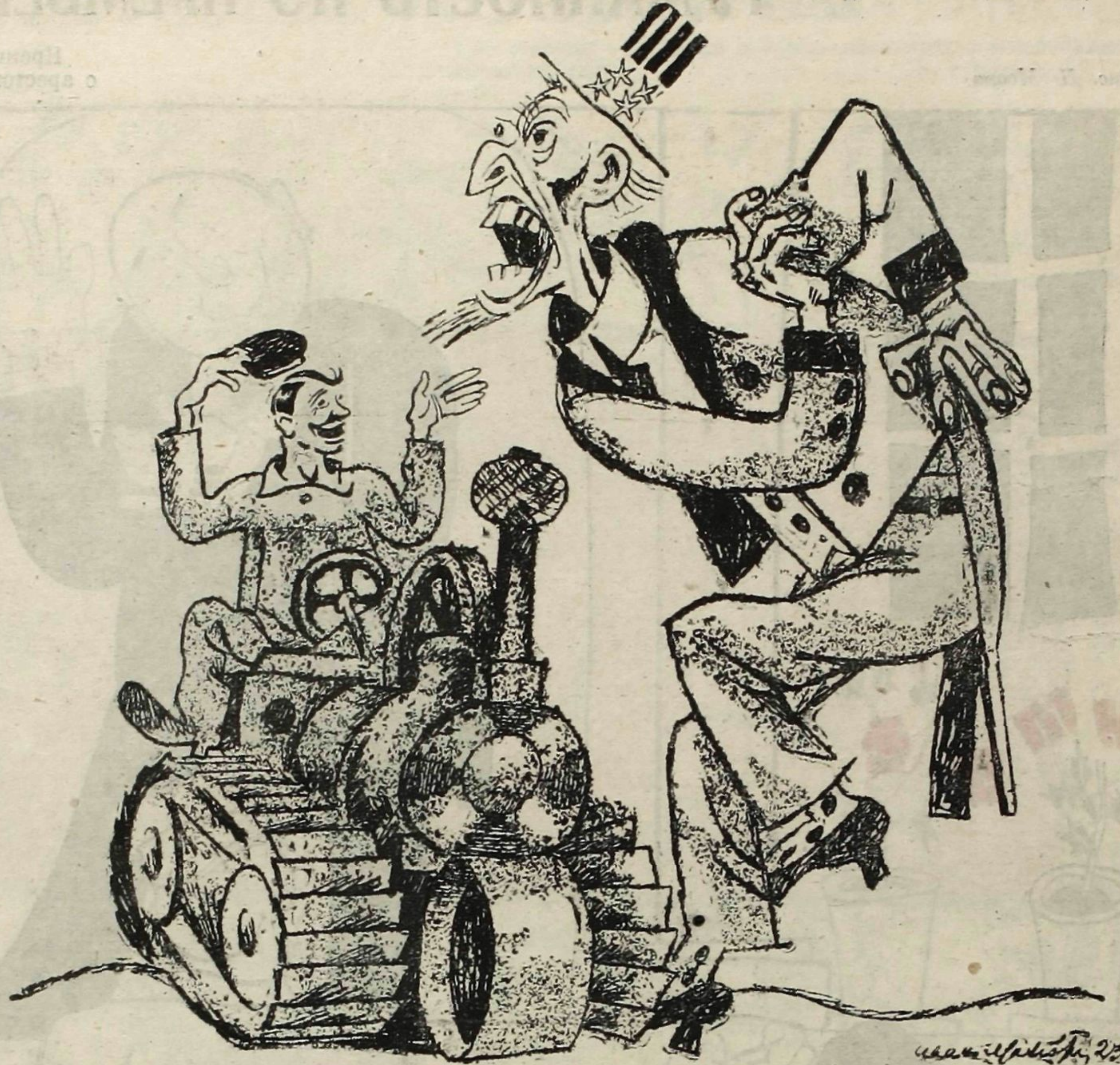
Америна (питерскому рабочему): — Сто дьяволов! Ты наступил мне на самую любимую мозоль!

Петроградские заводы начали выпускать Тракторы дешевле американских на 40%. (Из газет).