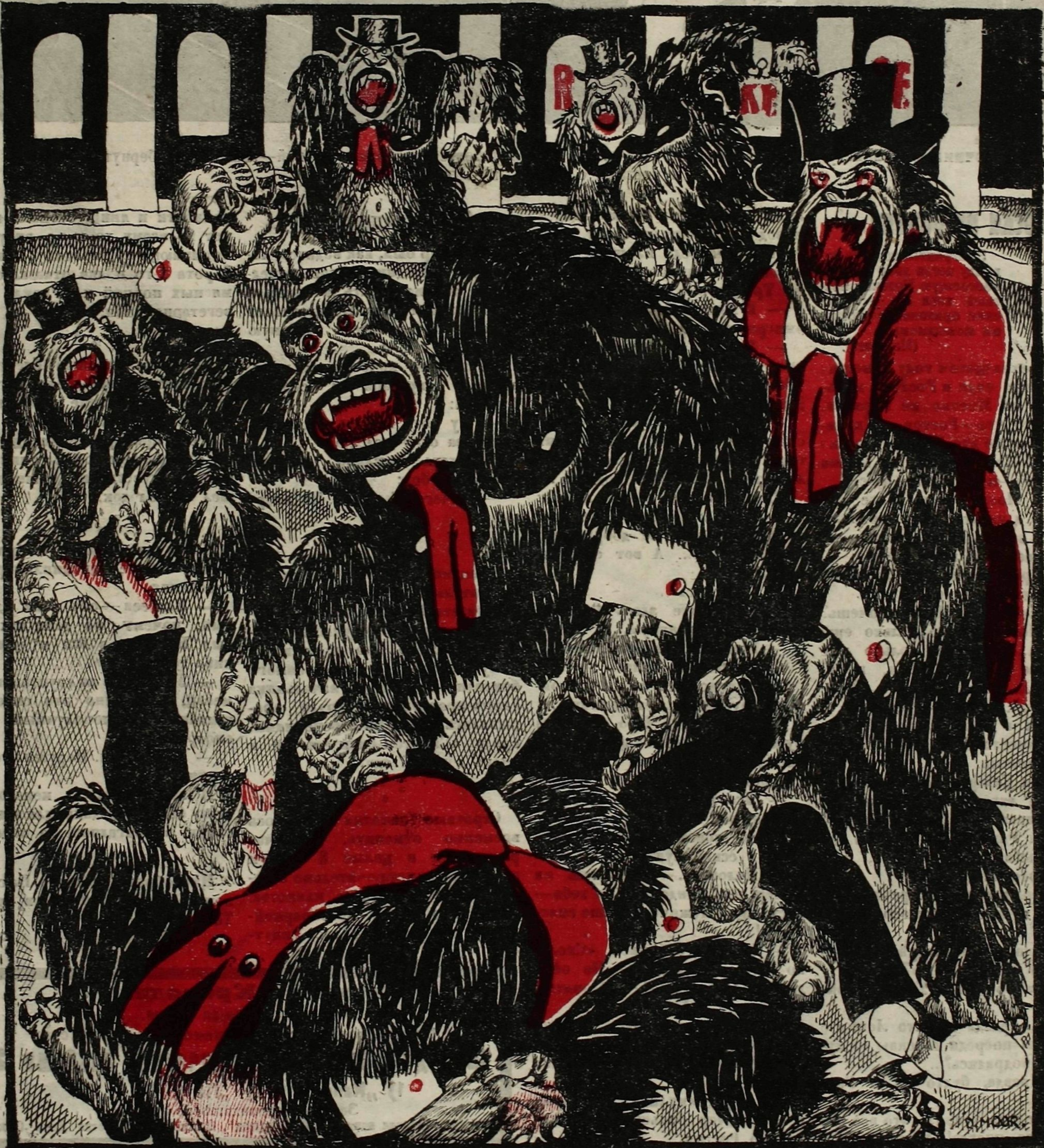
«Гориллы не терпят в своей среде человека. Завидев его, они набрасываются целыми стаями, и горе тому, кто невооруженным попадет в их лапы и на их нлыки» (Почти из Брэм)