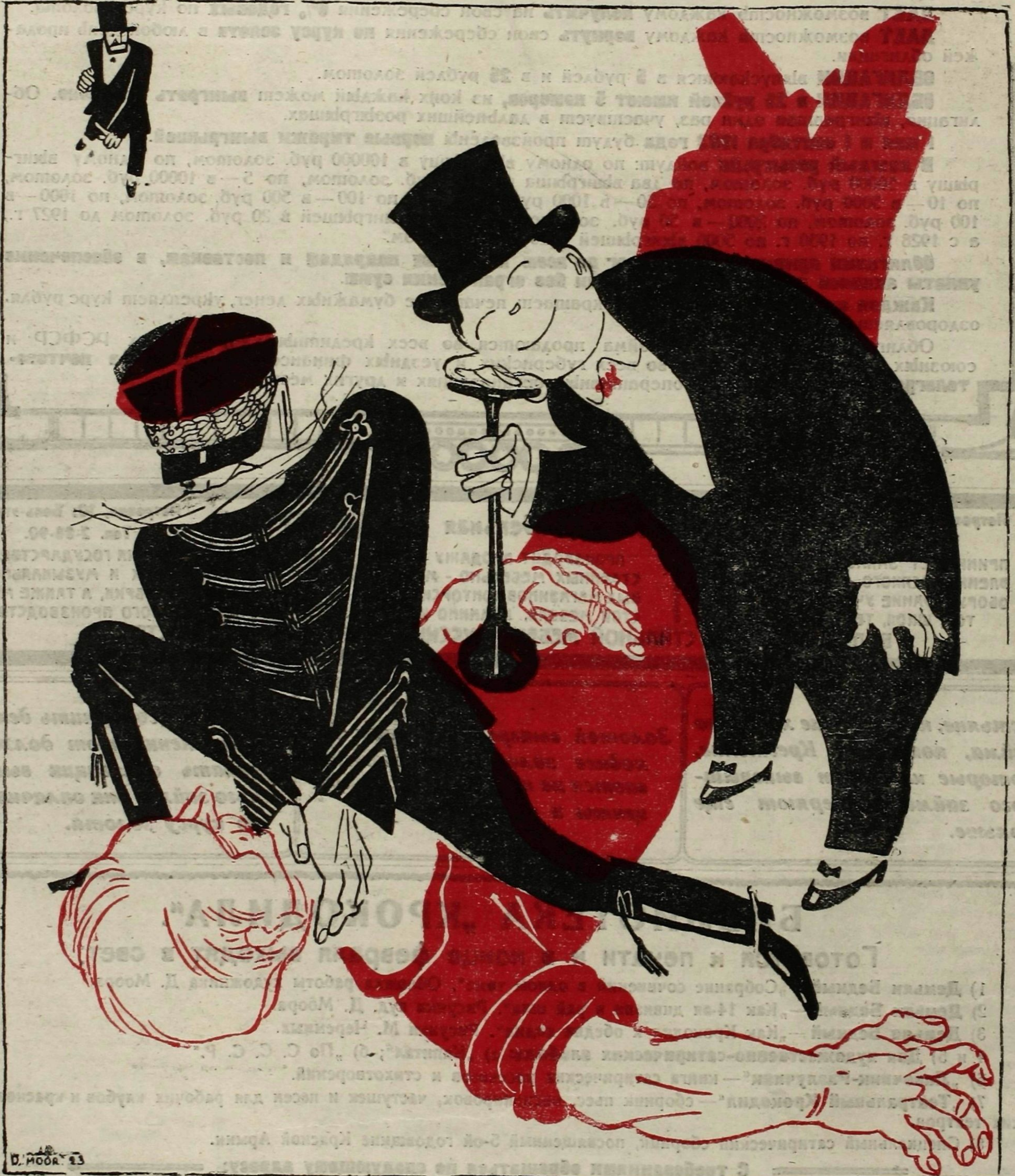
Рис. Д. Моора

Французская „Лига прав человека“ констатирует незаконность вторжения французов в Рурский район.