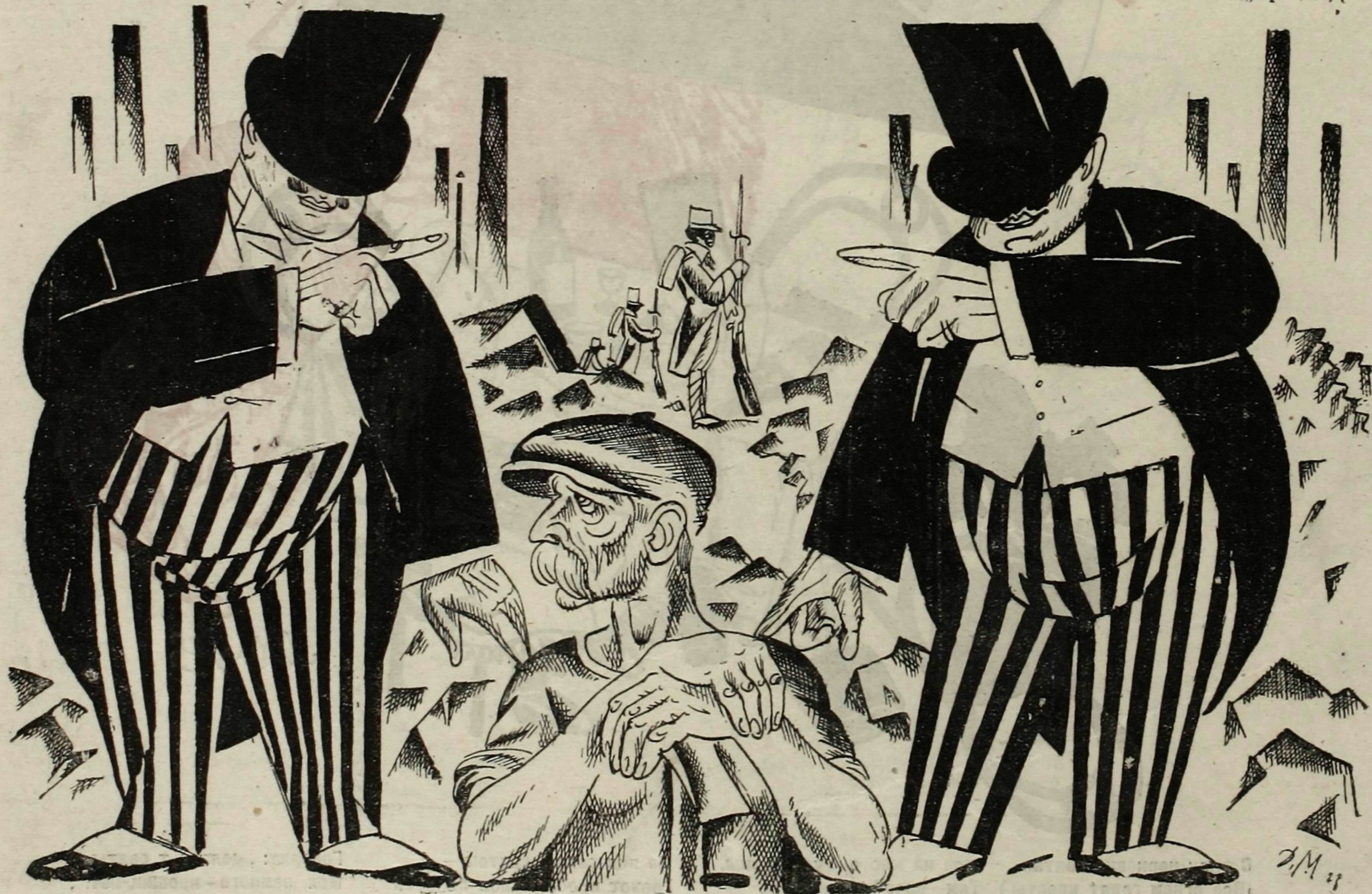
Рис. Д. Мельникова.

Немецкии капиталист (немецкому рабочему): — Французский капиталист громит твою родину. Это твой национальный враг. Французский капиталист (немецкому рабочему): — Немецкий капиталист — твой классовый враг, а я твой друг и желаю тебе добра. Рабочий: — А какая между вами разница? По моему, вы — одного поля ягода!